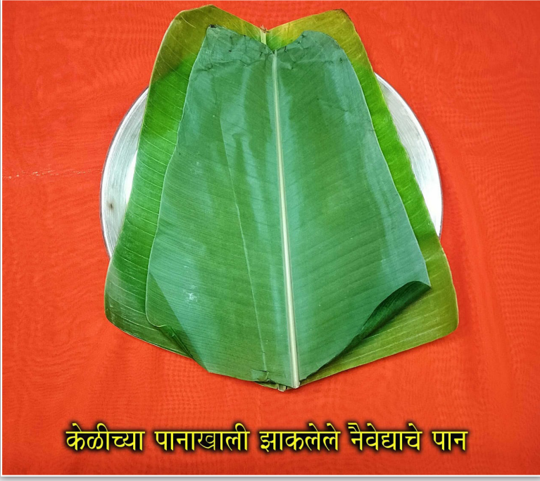
केळीच्या पानाखाली झाकलेले नैवेद्याचे पान

त्या अन्नावर आपली वासना जाऊ नये म्हणून आपले डोळे झाकून घेणे, देवाला नैवेद्य दाखवून झाल्यावर काही काळ देवापुढील पडदा लावून घेणे, अशा गोष्टी