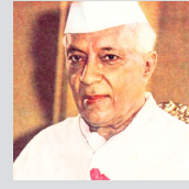
- पं. जवाहरलाल नेहरू