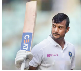
रुग्णालयात हलवण्यात आले. अग्रवाल याच्यावर रुग्णालयातील अतिदक्षता विभागात उपचार सुरू आहेत. विमानातील कर्मकात्यांनी पाण्याची बाटली ताब्यात घेऊन तपास सुरू केला. सुत्रांनी दिलेल्या माहितीनुसार, पिण्याच्या पाण्यात अॅसिड मिसळल्याचा संशय आहे. हिंदा आलेल्या वृत्तानुसार तो आऊट ऑफ डॅंजर आहे...

पिण्याच्या पाण्यात अॅसिड मिसळल्याची शक्यता वृत्तसंस्था त्रिपुरा भारतीय क्रिकेट संघाचा खेळाडू आणि कर्नाटक रणजी संघाचा कर्णधार मयंक अग्रवाल याला विमानात विषबाधा झाल्याची माहिती समोर आली आहे. फ्लॉयडमध्ये पाणी प्यायल्याने अग्रवाल आजारी पडला आणि त्याला तातडीने रुग्णालयात दाखल करण्यात आले. त्रिपुरातील आगतळा येथून सुरतला जात असताना ही घटना घडली. मयंकने सीटसमोर ठेवलेले पाणी प्याले. पाणी प्यायल्याबरोबर त्याची जीभ, तोंड आणि गाल भाजल्यासारखे झाले. मयंकला बोलाता येत नव्हते. त्याला तातडीने आगतळा येथील आयएएस