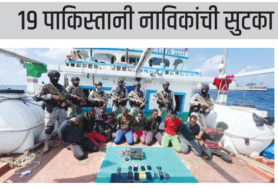
सोमवारी रात्री सोमालिया डाकूनी या सर्वांचे अपहरण केले होते. भारतीय नौदलाने यासंदर्भातील माहिती मिळताच ऑपरेशन सुरू करण्यात आले. सर्व पाकिस्तानी नाविकांची सुटका केली. मागील 24 तासांत भारतीय नौदलाने 19 पाकिस्तानी आणि 17 इराणी नागरिकांना समुद्र लुटारूपासून वाचवले.