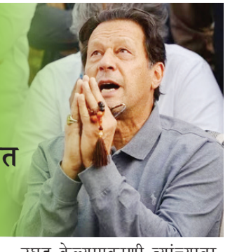
त्याआधी इम्रान खान यांना झालेल्या या शिक्षेमुळे त्यांच्या पीटीआय पक्षाला मोठे नुकसान सहन करावे लागू शकते. इम्रान खान (वय ७१) आणि कुरेशी (६७) यांना रावलपिंडीच्या अदियाला तुरुंगात ठेवण्यात आले आहे. गोपनीय राजनैतिक कागदपत्र उघड केल्याप्रकरणी त्यांच्यावर आरोपपत्र दाखल करण्यात आला होता. याप्रकरणी त्यांच्याविरोधात गुन्हा दाखल करण्यात आला. इम्रान खान यांनी आपल्यावरील कारवाई राजकीय हेतूने प्रेरित असल्याचा दावा केला होता. सिफर प्रकरणाचा संबंध गोपनीय राजनैतिक

वृत्तसंस्था इस्लामाबाद पाकिस्तानचे माजी पंतप्रधान आणि पीटीआयचे अध्यक्ष इम्रान खान यांना 10 वर्षांचा तुरुंगवासाची शिक्षा सुनावण्यात आली आहे. सिफर प्रकरणात त्यांना ही शिक्षा झाली आहे. त्यांच्यासोबत पीटीआयचे उपाध्यक्ष शाह महम्मद कुरेशी यांना देखील 10 वर्षांची शिक्षा झाली आहे. या शिक्षेमुळे इम्रान खान यांची राजकीय कारकीर्द संपुष्टात येण्याची शक्यता आहे. विशेष कोर्टाने ऑफिशियल सिव्हेट अॅक्टच्या अंतर्गत ही शिक्षा सुनावली असल्याचे पाकिस्तानच्या डॉन वृत्तपत्राने सांगितले आहे. पाकिस्तानमध्ये ८ फेब्रुवारी रोजी सार्वत्रिक निवडणुका होणार आहेत.