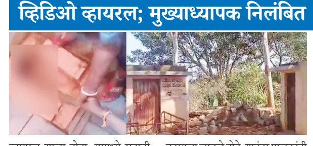
व्हायरल झाला होता. यामध्ये सहावी वर्गातील दोन मुले शौचालयात झाडू मारताना दिसले. घटनेनंतर मुख्याध्यापकाला निलंबित करण्यात आले. कोलारमध्ये 7 विद्यार्थ्यांनी स्वच्छतागुहाची स्वच्छता करून सेप्टिक टँकमधील कचरा हाताने गोळा केला. 17 डिसेंबर रोजी कर्नाटकातील कोलार जिल्ह्यातील मोरारजी देसाई निवासी शाळेचा व्हिडिओ व्हायरल झाला होता. यामध्ये 7 विद्यार्थी स्वच्छतागुहे व सेप्टिक टँकाच्या स्वच्छता करताना दिसले.

वृत्तसंस्था नवी दिल्ली सोमवारी रात्री सोमालिया डाकूनी या सर्वांचे अपहरण केले होते. भारतीय नौदलाने यासंदर्भातील माहिती मिळताच ऑपरेशन सुरू करण्यात आले. सर्व पाकिस्तानी नाविकांची सुटका केली. मागील 24 तासांत भारतीय नौदलाने 19 पाकिस्तानी आणि 17 इराणी नागरिकांना समुद्र लुटारूपासून वाचवले. आरे. समुद्री डाकूपासून इतर जहाजांना सुरक्षा देण्याचे कामगिरी या जहाजावर सोपवण्यात आली आहे. कोचीनपासून 800 मैल लांब असणाऱ्या जहाजांना आयएनएस सुमित्राने वाचवले. लाल समुद्र आणि अरबी समुद्राच्या परिसरात चाच्यांची दहशत पाहायला मिळत आहे. येथे व्यावसायिक जहाजांना लक्ष्य करण्यासाठी ड्रोन हल्ले केले जात आहेत. 7 ऑक्टोबर 2023 रोजी सुरू झालेल्या इराण-इराक हिंसाचारामध्ये सुमित्रा हे अनेक क्षेपणास्त्रे आणि ड्रोनद्वारे अनेक व्यापारी जहाजांना लक्ष्य केले आहे. यामुळे भारतीय आयएनएस सुमित्राने या भागात मोर्चा पाडले. आयएनएस सुमित्रा हे जहाज भारतीय तटरक्षक दलाचे