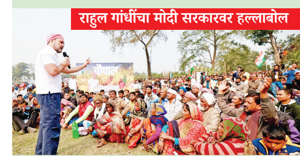
राहुल गांधींचा मोदी सरकारवर हल्लाबोल