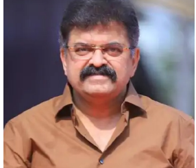
कबीर, संत रविदास, जगद्गुरु संत तुकाराम महाराज यांची पुस्तके उघडून बघा, तुम्हाला कुठेही धर्मद्वेष दिसणार नाही. किंबहुना, या सर्वांची शिकवणूक होती की, सर्व धर्मांनी एकत्र राहिले पाहिजे. असे असताना

प्रतिनिधी ठाणे महाराष्ट्रातील धार्मिक तसेच सामाजिक स्वास्थ्य त्यानिमित्ताने हे सत्ताधारी बिडविण्याचा प्रयत्न करीत आहेत, हे आता लपून राहिलेले नाही. हा खेळ आता महाराष्ट्राला जाळून टाकेल. रामगिरी महाराजांकडून मुद्दामहून शब्द वदवून घेण्यात आले असा खळबळजनक आरोप शरद पवार गटाचे आमदार जितेंद्र आव्हाड यांनी केला आहे. महंत रामगिरी महाराज यांनी केलेल्या विधानाबद्दल जितेंद्र आव्हाड यांनी