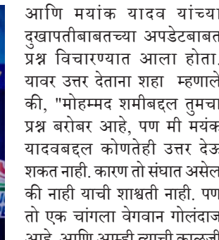
जय शहा यांना टीम इंडियामध्ये त्याच्या खेळण्याच्या शक्तीबाबत विचारले असता ते म्हणाले की, खेळाडूची निवड होईल की नाही याची शाश्वती देऊ शकत नाही. जय शहा यांना मोहम्मद शमी

प्रतिनिधी नवी दिल्ली भारताचा वेगवान गोलंदाज मयंक यादव सध्या बंगळूर येथील राष्ट्रीय क्रिकेट अकादमीमध्ये आहे. या वेगवान गोलंदाजाने आयपीएल २०२४ मध्ये केवळ चार सामने खेळले, परंतु त्याने आपल्या वेगाने खळबळ उडवून दिली. मयंकने आयपीएल २०२४ मध्ये ६.९९ च्या इकॉनॉमीने सात विकेट घेतल्या. मयंक यादवला १५० पेक्षा जास्त वेगाने चेंडू फेकण्यात कोणतीही अडचण येत नव्हती. या काळात त्याने ताशी १५६.७ किमी वेगाने चेंडूही टाकला. भारतीय क्रिकेट नियामक मंडळाचे (बीसीसीआय) सचिव