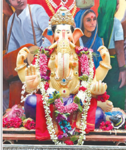
श्री गोवर्धन भुवन चा राजा (खेलवाडी) गिरगाव मधील विराजमान बाप्पा