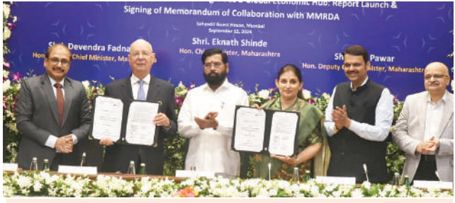
विस्तीर्ण समुद्र किनाऱ्यांमुळे पर्यटन उद्योगालाही चालना मुंबई, पालघर, ठाणे आणि रायगड या जिल्हांचा समावेश असलेल्या या संकल्पनेतून या परिसरात मोठ्या क्षमतेचे डाटा सेंटर, वाढवण, दिग्घी या बंदरांमुळे परिसराचा कायापालट होईल. विस्तीर्ण समुद्र किनाऱ्यामुळे पर्यटन उद्योगालाही चालना मिळेल. महाराष्ट्रात उद्योगांसाठी पोषक वातावरण आहे. गुंतवणूकदारांना सुविधा देण्यात येताहेत. महाराष्ट्र परकीय गुंतवणूक मिळवणारे भारतातील प्रथम क्रमांकाचे राज्य आहे. यामुळे रोजगार, स्टार्टअप, क्लीन एनर्जी यामध्येही महाराष्ट्र नेतृत्व करत असल्याचेही मुख्यमंत्री म्हणाले.

प्रतिनिधी मुंबई वर्ल्ड इकॉनॉमिक फोरम आणि मुंबई महानगर क्षेत्र विकास प्राधिकरण-एमएमआरडीए यांच्यातील सामंजस्य करारामुळे मुंबईचे जागतिक आर्थिक केंद्राचे स्वप्न दृष्टीपथात आले आहे. यातून आगामी काळात मुंबईचा जीडीपी - सकल उत्पन्न दृष्टीत होईल असे मुख्यमंत्री एकनाथ शिंदे यांनी येथे सांगितले. तर निती आयोगाने महाराष्ट्राच्या एक लाख कोटी डॉलर्स - व ट्रिलियन डॉलर्स इकॉनॉमीच्या दिशेने टाकलेल्या पावलांना बळ दिले आहे, असे उपमुख्यमंत्री देवेंद्र फडणवीस यांनी सांगितले. मुख्यमंत्री शिंदे, उपमुख्यमंत्री देवेंद्र फडणवीस यांच्या उपस्थितीत आज सहाद्री राज्य अतिथीगृह येथे मुंबई महानगर प्रदेश (एम.एम.आर.) ला जागतिक आर्थिक केंद्र म्हणून विकसित करण्याबाबत निती आयोगाच्या अहवालाचे प्रकाशन करण्यात आले. तसेच मुंबई महानगर क्षेत्र विकास प्राधिकरण- एमएमआरडीए व वर्ल्ड इकॉनॉमिक फोरम यांच्या एमएमआर