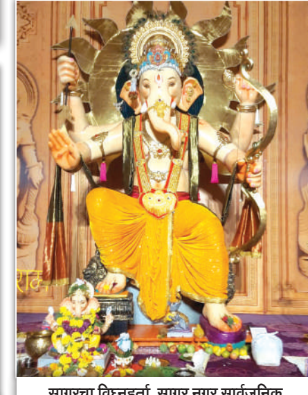
सागरचा विघ्नहर्ता, सागर नगर सार्वजनिक गणेशोत्सव मंडळ, वाकोला, सांताक्रूझ (पूर्व), मुंबई