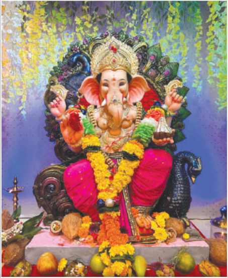
वेदांत इंपिरियल मधील विराजमान वेदांत इंपिरियल राजा