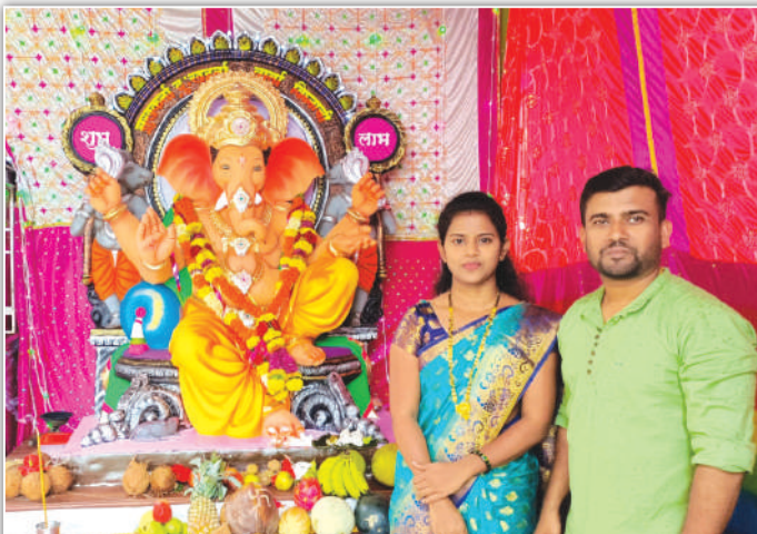
अलिबाग तालुक्यातील सुप्रसिद्ध हाशिवन्याचा राजा ची सुबक मूर्ती