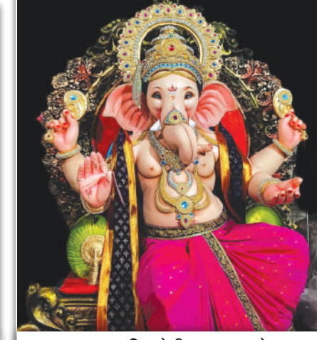
बदलापूर पश्चिम येथील कृष्णा इस्टेट सार्वजनिक उत्सव मंडळ, वर्ष १७ वे हि मनमोहक गणेशमूर्ती दिसत आहे.