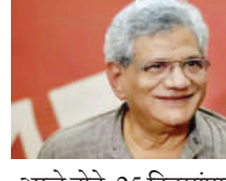
आले होते. 25 दिवसांपासून त्यांच्यावर उपचार सुरू होते.

नवी दिल्ली : मार्क्सवादी कम्युनिस्ट पक्षाचे महासचिव सीताराम येचुरी यांचे वयाच्या 72 व्या वर्षी निधन झाले. त्यांना 19 ऑगस्ट रोजी खूप ताप आल्याने दिल्लीच्या एम्समध्ये दाखल करण्यात