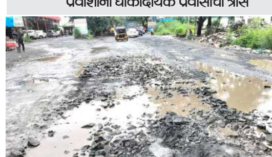
पवाशांना धोकादायक पवासाचा त्रास

प्रतिनिधी वसई मुंबई-अहमदाबाद महामार्गाला जोडणारा शिरसाड-वज्रेश्वरी राज्य मार्ग अत्यंत खडतर अवस्थेत आहे. सततच्या पावसामुळे रस्त्यावर मोठे आणि खोल खड्डे तयार झाले असून, त्यामुळे प्रवाशांना दररोज जीवघेणा प्रवास करावा लागत आहे. या रस्त्यावर पावसाचे पाणी साचल्याने खड्डे आणखीनच धोकादायक बनले आहेत. वाहन चालकांना खड्डे चुकवत हळूहळू गाडी चालवावी लागत असून, त्यामुळे वाहनांची गती कमी होत आहे आणि परिणामी वाहतूक कोंडी निर्माण होते. विशेषतः मांडवी, चौदीप, पारोळ, शिरवली या गावांच्या परिसरातील रस्त्यांवर खड्ड्यांची संख्या अधिक आहे. सार्वजनिक बांधकाम विभागाने अनेक वेळा खड्डे बुजवण्याचे काम केले आहे, परंतु अवजड वाहतूक आणि वाहनांच्या सततच्या वर्दळीमुळे हे उपाय अपूर्ण ठरत आहेत. खड्डेमुळे प्रवासात होणारी अडचण विद्यार्थ्यांपासून कामगारांपर्यंत सर्वांचा भेडसावत आहे. खड्डे चुकवताना होणारे अपघात आणि दुचाकीस्वारांचा समतोल बिघडून होणारी पडझड यामुळे स्थानिक नागरिक त्रस्त झाले आहेत. या समस्येवर तात्पुरत्या उपाययोजनांपेक्षा टिकाऊ डंबर किंवा कॉन्क्रीटचा वापर करून खड्डे कायमस्वरूपी बुजविणे आवश्यक आहे, अशी मागणी नागरिकांकडून होत आहे.