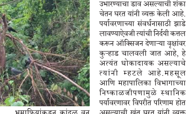
भूमाफियांकडून कांदळ वन तोडून तिथे अनधिकृत बांधकामे