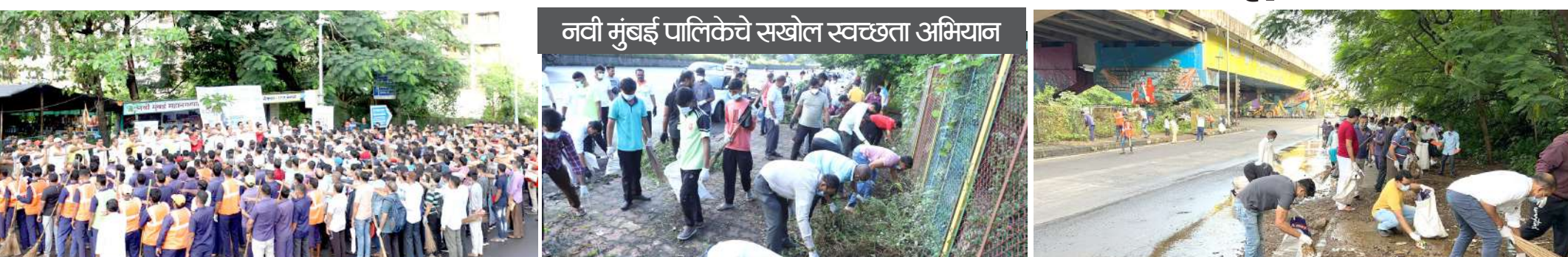
नवी मुंबई पालिकेचे सखोल स्वच्छता अभियान