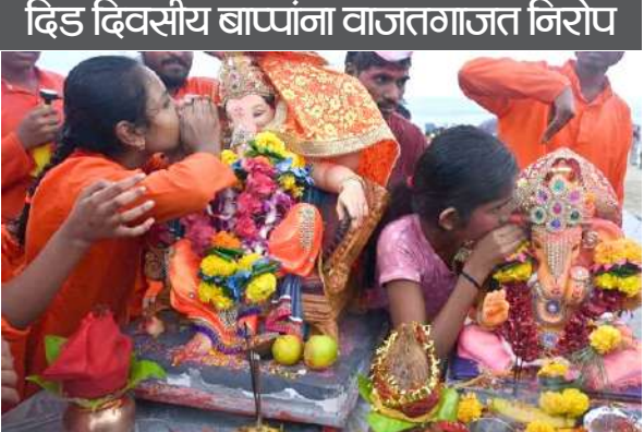
दिड दिवसीय बाप्पांना वाजतगाजत निरोप

प्रतिनिधी वसई- विरारमध्ये दिड दिवसासाठी प्रतिष्ठाने झालेल्या गणरायांच्या आगमनाचा मोठा जल्लोष साजरा झाला. रविवारी दिड दिवसीय बाप्पांना वाजतगाजत निरोप देण्यात आला. एकूण 13,426 गणरायांना वाजत गाजत भावपूर्ण वातावरणात निरोप देण्यात आला. यात 110 सार्वजनिक तर 13316 खाजगी गणरायांचा समावेश होता. वसई - विरार शहर