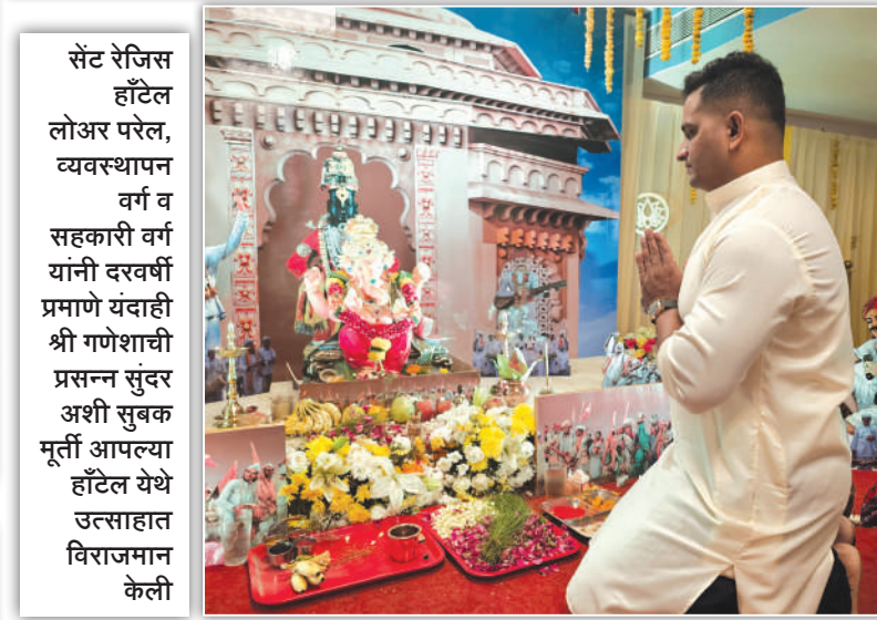
सेंट रेजिस हॉटेल लोअर परेल, व्यवस्थापन वर्ग व सहकारी वर्ग यांनी दरवर्षी प्रमाणे यंदाही श्री गणेशाची प्रसन्न सुंदर अशी सुबक मूर्ती आपल्या हॉटेल येथे उत्साहात विराजमान केली