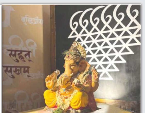
गोरेगांव पश्चिम येथील बेस्टनगर सार्वजनिक गणेशोत्सव मंडळाने यंदा ५५ व्या वर्षीही सामाजिक देखावा उभा केला आहे. मंडळ दरवर्षी भक्तांना बाप्पाला एक पेन व पुस्तक वाहण्याचे आवाहन करत असते. व ते नंतर गरजू विद्यार्थ्यांना देण्यात येते. या वर्षी मंडळाने मिळालेल्या पेन व पुस्तकांचाच गाभारा तयार करून सामाजिक देखावा उभारला आहे. गणेशोत्सवानंतर हे पेन पुस्तके दरवर्षी प्रमाणे गरजू विद्यार्थ्यांना देण्यात येणार आहे.