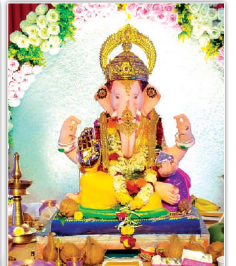
राम मारुती रोड (आसपास) सार्वजनिक गणेश उत्सव मंडळ, दादर