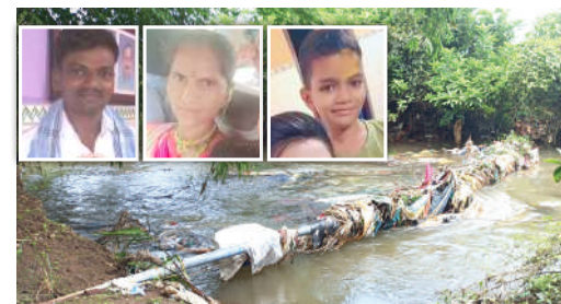
ऐन गणेशोत्सवात कर्जतमध्ये भीषण तिहेरी हत्याकांड

मराठी अस्मितेचा आवाज बुलंद करण्याचे कार्य गेली २७ वर्षे करणारे 'दैनिक वृत्तमानस' आता घरोघरी पोचवण्याचे काम आम्ही करणार आहोत. वाचकांना आमच्या लोकप्रिय दैनिकाची प्रत उपलब्ध होत नसेल तर या दूरध्वनीवर संपर्क साधावा. दातार अँड सन्स न्युज पेपर डिस्ट्रिब्युटर्स भ्रमणध्वनी - ८६५५१९४४५२, ८५९१६६२६६, ९८६७३०८०६३