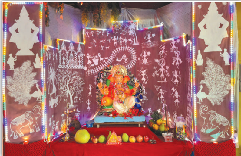
कदमांचा राजा - मु.पो.आरे (आरेश्वर वाडी) देवगड, वारली कलाकृतीचा देखावा सादर केला आहे.