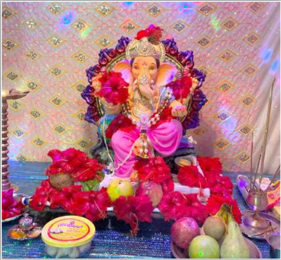
पाडावे परिवार वाणी वाडी, ता. वैभववाडी, जिल्हा सिंधुदुर्ग यांच्या घरी विराजमान झालेली श्री गणराय