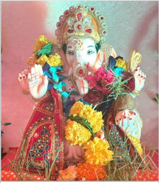
अंशूलचा राजा, महावीर नगर, कादिवली पश्चिम, वर्ष ३ रे... दरवर्षी इको फ्रेंडली मूर्ती आणि सजावट