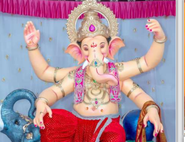
नवीन मुंबई, साणभाडा, सेक्टर ९ मधील मिलेनियम टॉवर वी टाईप सोसायटीचा सार्वजनिक गणपती