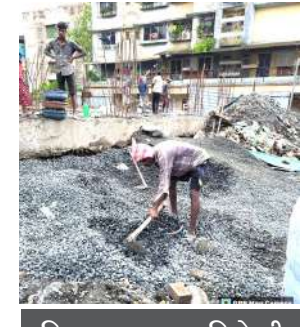
बिल्डरला महापालिकेची दंडात्मक नोटीस

प्रतिनिधी वसई नालासोपारा-समेळपाडा येथील अनधिकृत बांधकामामुळे परिसरातील गटारे तुंबून पाणी शिरल्याने नागरिकांना त्रास सहन करावा लागला आहे. इमारतींच्या आवारात साचलेल्या पाण्यामुळे विज पुरवठा खंडीत करण्यात आला असून, महापालिकेने या प्रकाराची गंभीर दखल घेत संबंधित बिल्डरला दंडाची नोटीस बजावली आहे. समेळपाडा येथील एका बहुमजली इमारतीच्या बांधकामासाठी गटाराच्या स्लॅबवर मोठ्या प्रमाणात बांधकाम साहित्य टाकण्यात आल्यामुळे गटारे तुंबली आहेत. परिणामी परिसरातील पावसाचे पाणी वाहून न जाता रस्त्यावर व इमारतींमध्ये शिरत आहे. बुधवारी आणि गुरुवारी झालेल्या पावसामुळे पाण्याने विज मीटरमध्ये शिरकाव केल्यामुळे, दुर्घटना टाळण्यासाठी महाविहतरण कंपनीने काही इमारतींचा विज पुरवठा खंडीत केला. महापालिकेच्या आरोग्य आणि घनकचरा विभागाने या प्रकरणाची