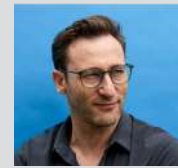
-सिमॉन सिनेक अमेरिकन लेखक

३०-०९-२०२४ ते ०६-१०-२०२४ (रविवार ते शनिवार)