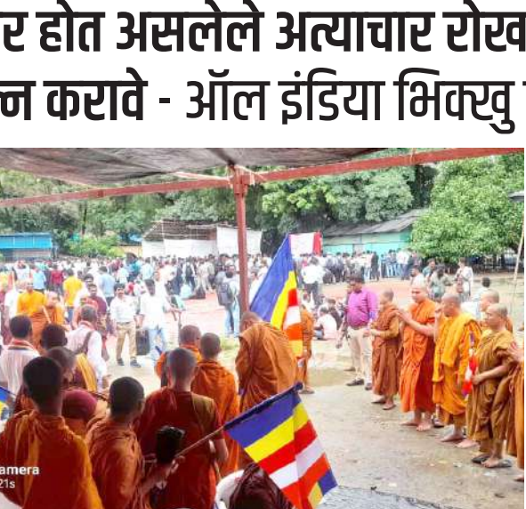
महटले की, बांगलादेशातील बौद्ध, ख्रिश्चन, हिंदू सुरक्षित नाही, बांगलादेशातील सरकार हल्ले

प्रतिनिधी मुंबई भिक्खू संघ मुंबई व चकमा असोसिएशन महाराष्ट्र यांच्या वतीने बांगलादेशामध्ये बौद्ध ख्रिश्चन व हिंदू समुदायावर होत असलेल्या अत्याचारांच्या घटनांचा जाहीर निषेध करण्यासाठी मुंबईतील आझाद मैदान येथे भिक्खू संघाच्या वतीने शुक्रवारी परणे आंदोलन करण्यात आले. यामध्ये महाराष्ट्रातून चकमा असोसिएशनचे व भिक्खू संघाचे सर्व भदंत मोठ्या संख्येने उपस्थित होते.