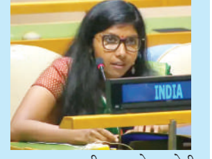
आमचा भूमीवर आहे, असेही भारतीय राजनैतिक अधिकारी म्हणाल्या. जम्मू-काश्मीरमधील निवडणुकीत सातत्याने दहशतवादाचा वापर केला आहे.