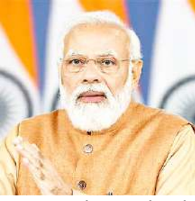
ती व्यवस्था लोकांना नको आहे. जम्मू-काश्मीरच्या जनतेला आता दहशतवाद, फुटीरतावाद आणि रक्तपात नको आहे. येथील लोकांना