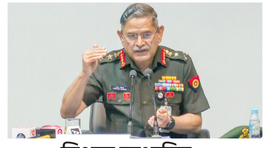
विश्वास प्रस्थापित करायला वेळ लागेल...