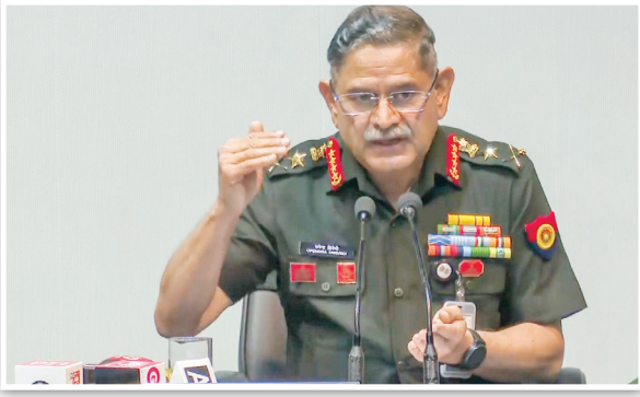
भारत आणि चीनने एक दिवस आधी 21 ऑक्टोबर रोजी गस्त घालण्यावर सहमती दर्शवली होती. परराष्ट्र मंत्री एस जयशंकर म्हणाले

होते की भारत आणि चीनमध्ये सीमेवर गस्त व्यवस्थेबाबत एक करार झाला आहे. यामुळे मे 2020 पूर्वीची परिस्थिती पूर्वपादावर येईल (गलवान संघर्ष). हे सकारात्मक आहे. लष्करप्रमुख म्हणाले. बरफ झोन व्यवस्थापन, डी-एस्केलेशन आवश्यक आहे