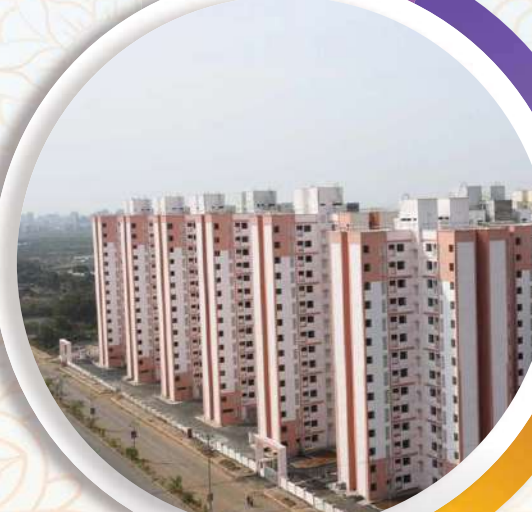
२६,५०२ सदनिकांच्या महागृहनिर्माण योजनेचा प्रारंभ