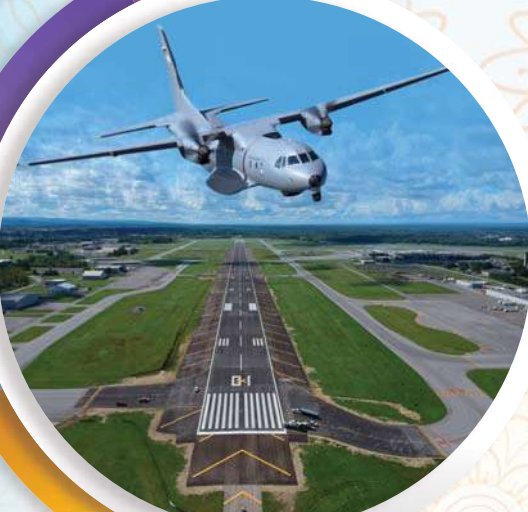
नवी मुंबई आंतरराष्ट्रीय विमानतळ येथे भारतीय वायु दलातर्फे सी-२९५ एअरक्राफ्टचे लँडिंग आणि सुखोई-३० एअरक्राफ्टचे फ्लायपास्ट

सिडको प्रदर्शन केंद्र, सेक्टर-३०, वाशी, नवी मुंबई