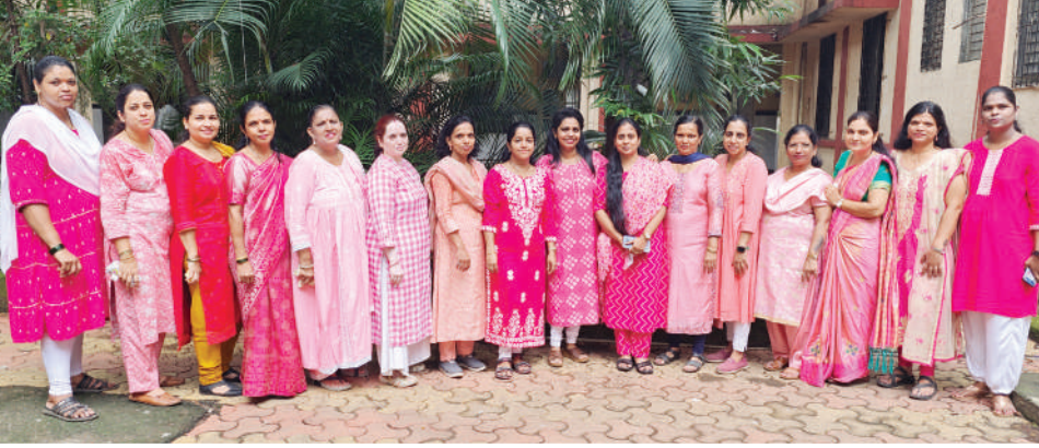
महिला कर्मचारी, कुर्ला कोर्ट.