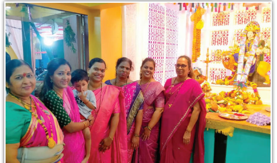
लक्ष्मीनारायण सोसायटी, इमामवाडा. सॅडहस्ट्रीड.