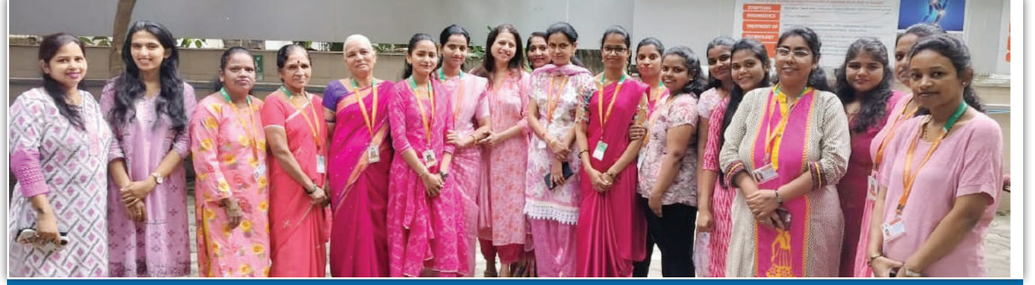
अपेक्स सुपरस्पेशलिटी हॉस्पिटलच्या महिला कर्मचारी