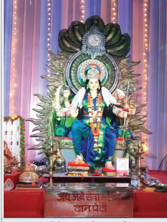
जय अंबे सेवा मंडळ, वारीवली (पश्चिम), रेल्वे स्थानकाजवळ