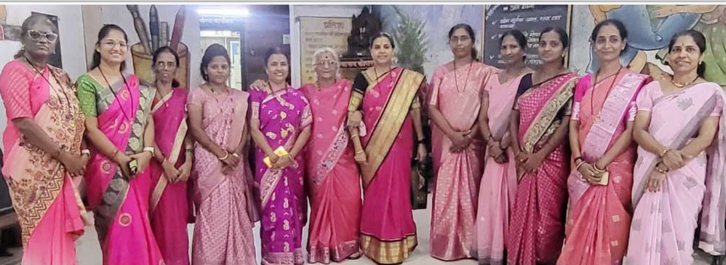
प्रबोधन, कुर्ला शाळेचा शिक्षकवृंद