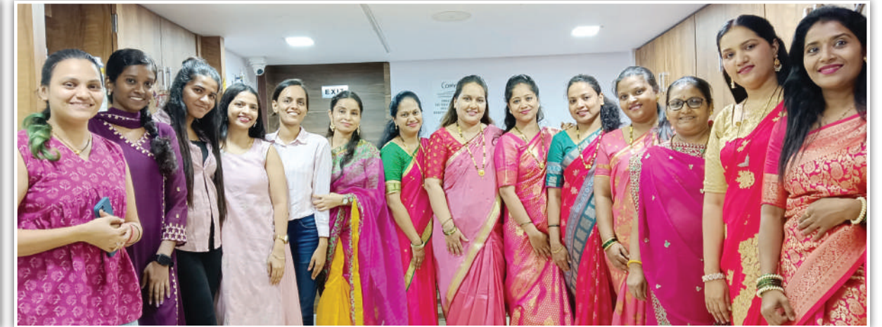
इनफ्लक्स हेलटेक लिमिटेड, कांदीवली(पश्चिम)