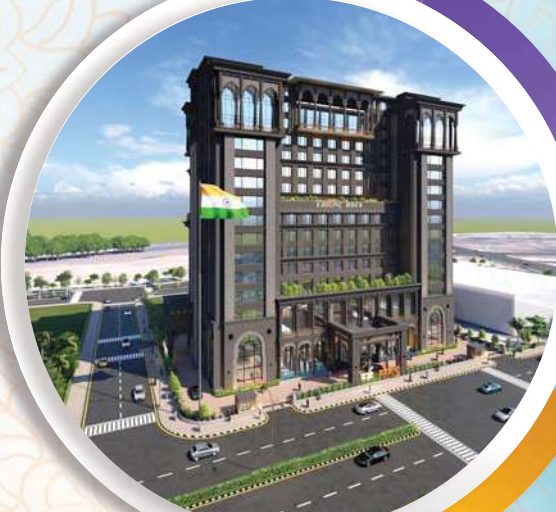
महाराष्ट्र भवनचे भूमिपूजन

१८ होल्सच्या आंतरराष्ट्रीय खारघर व्हॅली गोलफ कोर्सचे उद्घाटन