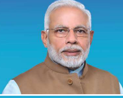
नरेंद्र मोदी पंतप्रधान