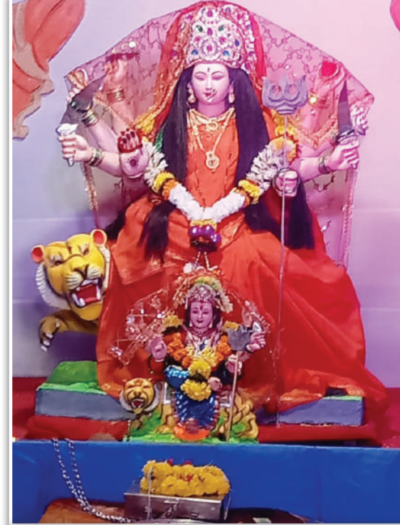
सार्वजनिक मित्र मंडळ कृष्णानगर, उल्हासनगर-४