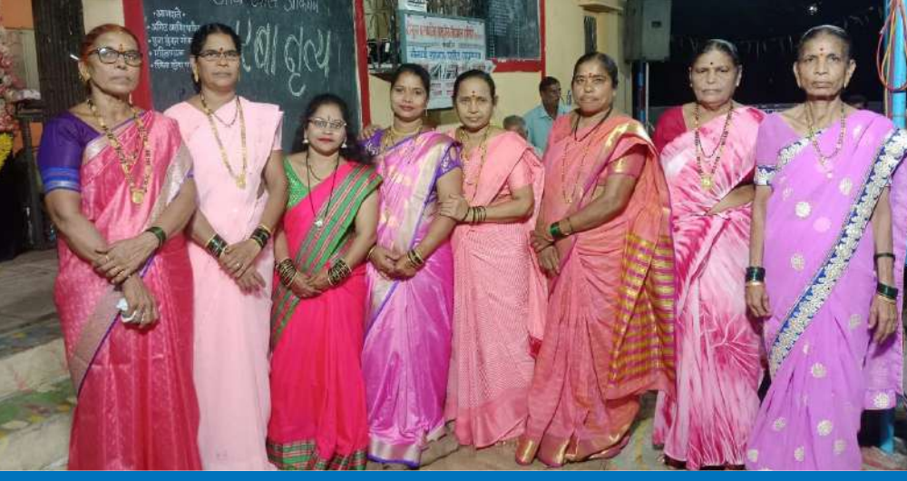
आई एकविरा महिला मंडळ, हाशिबरे, ता. अलिबाग.