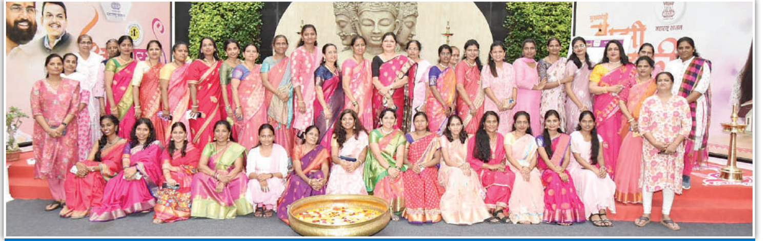
माहिती व जनसंपर्क महासंचालनालय, मंत्रालय, मुंबई