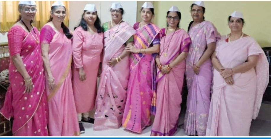
गुरुकृपा महिला भजन मंडळ... दादर