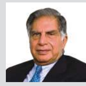
- रतन टाटा प्रसिद्ध उद्योगपती