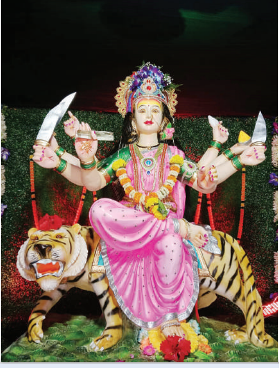
नूतन सामाजिक, सामाजिक सांस्कृतिक क्रिडा मंडळ, हाशिबरे येथील अंबामाता. चंदा या मंडळाचे 42 वे वर्ष आहे.