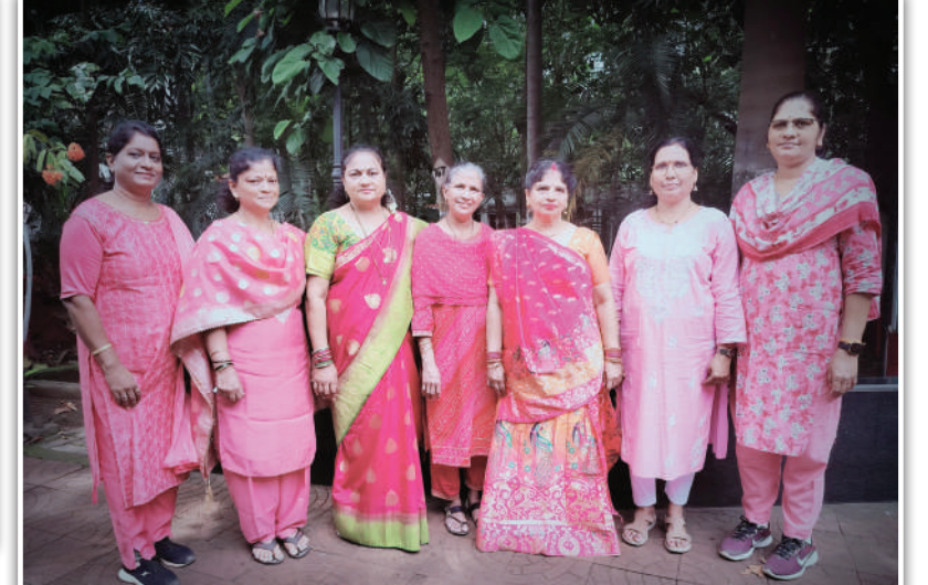
लोअर परेल कारखाना पश्चिम रेल्वे लिपिक विभाग.