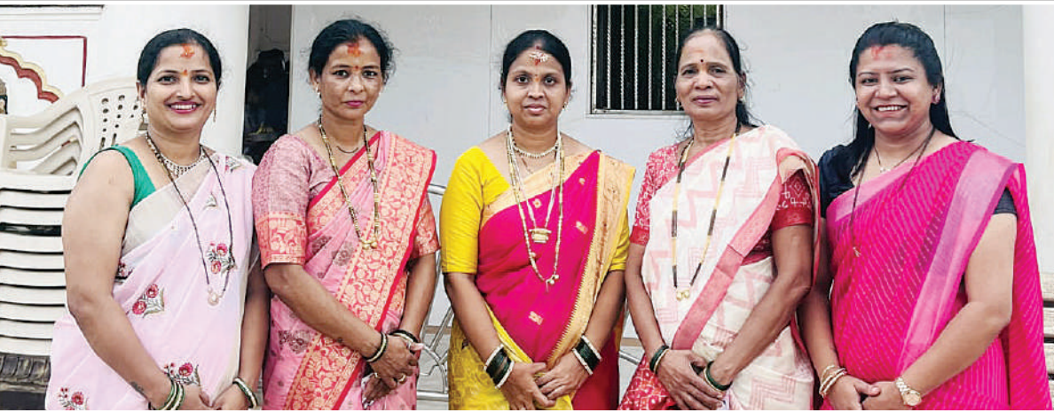
ओम साईराम महिला मंडळ, अंधेरी पूर्व