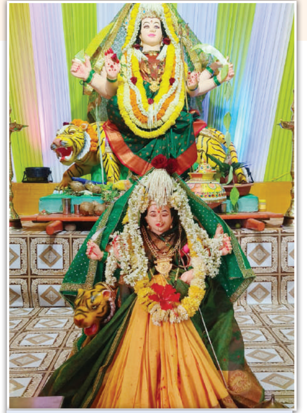
(दत्तनगरचीआई भवानी) दत्तनगर मित्र मंडळ आयोजित सार्वजनिक नवरात्री उत्सव मंडळ ...सुभाष नगर असल्फा विलेज घाटकोपर (पश्चिम)