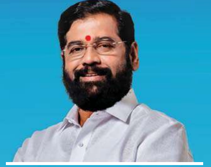
एकनाथ शिंदे मुख्यमंत्री, महाराष्ट्र राज्य