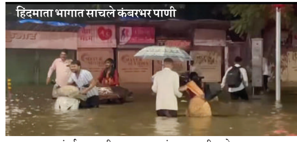
हिदमाता भागात साचले केदारपणगी दरम्यान, मुंबईत गुरुवारी हलक्या पावसाचा, तर शुक्रवारी वादळी वाऱ्यासह पाऊस कोसळण्याचा अंदाज हवामान विभागाने व्यक्त केला होता. मुंबईसह उपनगरात, तसेच ठाणे, कल्याण - डोंबिवली, बदलापुरात पावसाच्या जोरदार सरी गुरुवारी संध्याकाळी कोसळू लागल्या. यामुळे जनजीवन विस्कळीत झाले. तसेच या जोरदार पावसामुळे सखल भागात पाणी साचले. मात्र, अवेळी आलेल्या पावसामुळे मुंबईत गरबा खेळणाऱ्यांची मोठीच तारांबळ उडाली.

प्रतिनिधी मुंबई गेल्या काही दिवस उंसत घेतलेल्या पावसाने मुंबईत पुन्हा एकदा जोरदार बरसण्यास सुरुवात केली आहे. पावसाने घेतलेल्या विश्रांतीमुळे मुंबईत उकाडा वाढला होता. मात्र, गुरुवारी संध्याकाळी जोरदार पावसाने मुंबईकरांची दाणादाण उडवली. जिजांचा कडकडाट आणि ढगांच्या गडगडाटाने मुंबईकरांच्या मनात घडकीच भरली. या जोरदार पावसामुळे वातावरणात गारवा निर्माण झाला. अचानक आलेल्या पावसामुळे नोकदारांची तारांबळ उडाली.