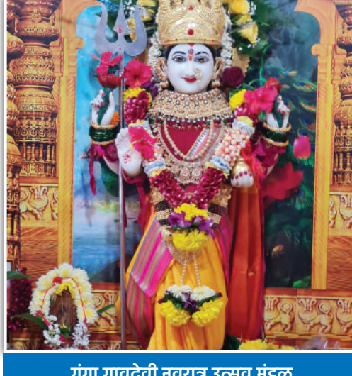
गंगा गावदेवी नवरात्र उत्सव मंडळ घोडदेव गाव भाईदर पूर्व