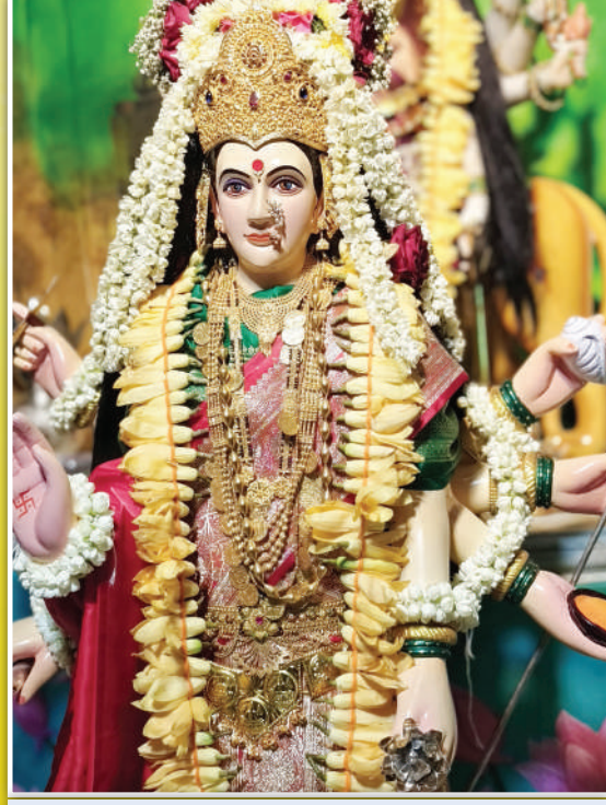
नवसाला पावणारी नायगावची चंदनाची भवानी माता मुंबई दादर पूर्व नायगाव सार्वजनिक नवरात्रोत्सव मंडळ