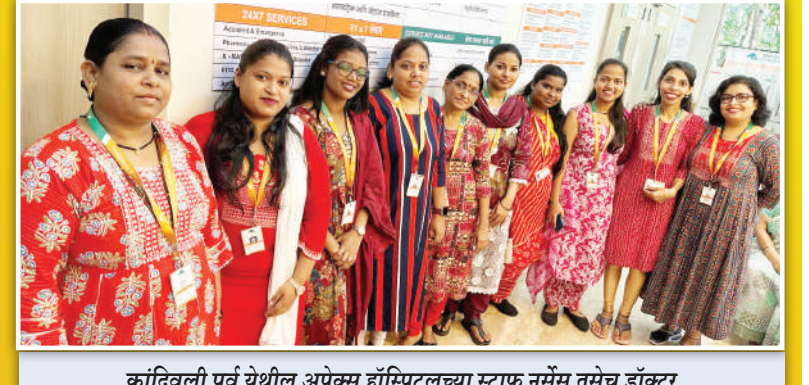
कांदिवली पूर्व येथील अपेक्स हॉस्पिटलच्या स्टाफ नर्सस तसेच डॉक्टर महिला व सहयोगी कर्मचाऱ्यांनी लाल रंग परिधान केला होता