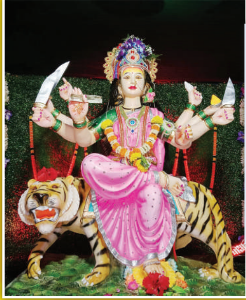
नूतन सामाजिक, सामाजिक सांस्कृतिक क्रिडा मंडळ, हाशिवरे येथील अंबामाता. यंदा या मंडळाचे 42 वे वर्ष आहे.