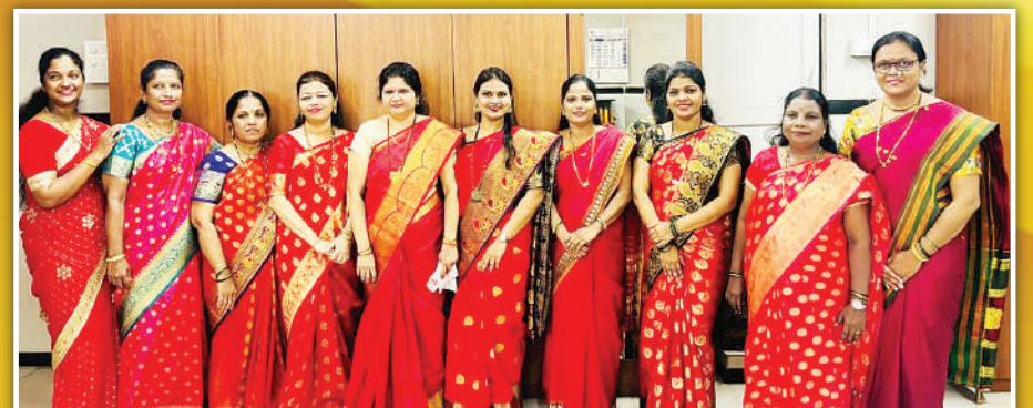
बांद्रा लोकल कोर्ट महिला