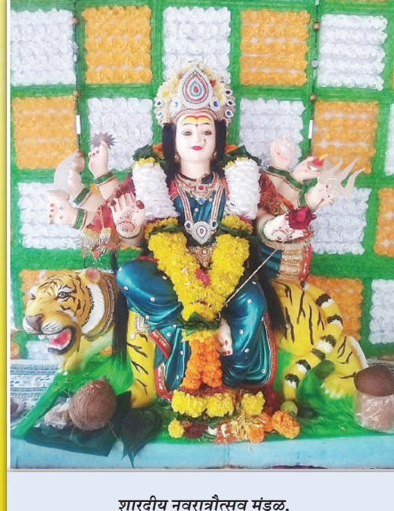
शारदीय नवरात्रोत्सव मंडळ, तातेर कॉम्प्लेक्स, कर्जत दहिवली