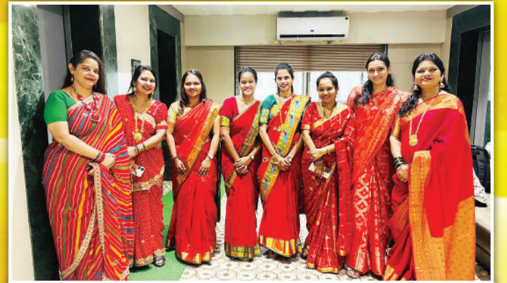
पॅरामार्केट हेल्थ सर्व्हिसेस अॅण्ड इन्शुरन्स प्रा. लिमिटेड