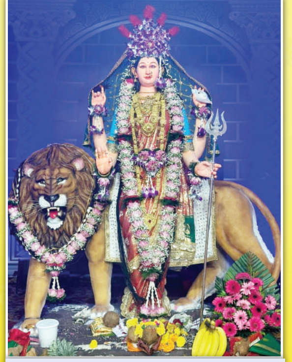
मुघभाट विकास मंडळ (मुघभाट) (नवसाला पावणारी गिरगावची अंबामाता)