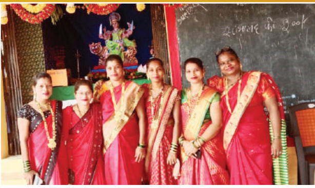
आई एकविरा महिला मंडळ, हाशिवरे, ता. अलिवाग.