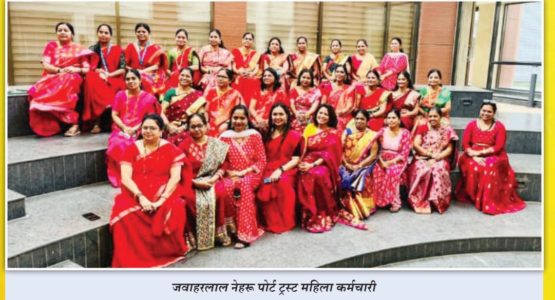
जवाहरलाल नेहरू पोर्ट ट्रस्ट महिला कर्मचारी