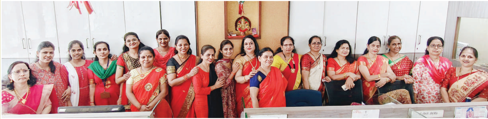
माहिती व जनसंपर्क महासंचालनालय, 17 वा मजला, मंत्रालय, मुंबई