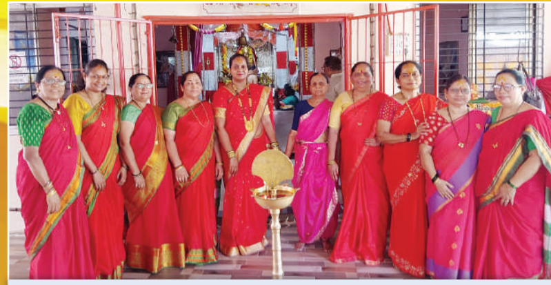
शिव शंभो सोसायटी. गोरार्ड ३ बोरिवली.