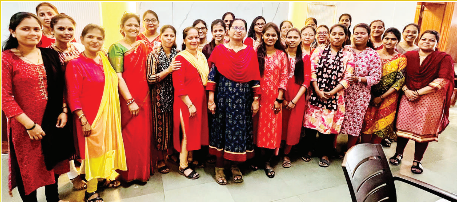
वित्तीय सल्लागार व उपसचिव कार्यालय, अन्न, नागरी पुरवठा व ग्राहक संरक्षण विभाग