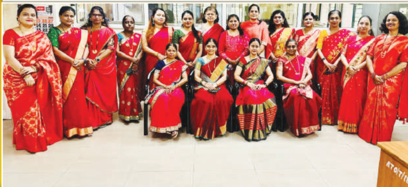
प्रादेशिक परिवहन कार्यालय,पुणे.