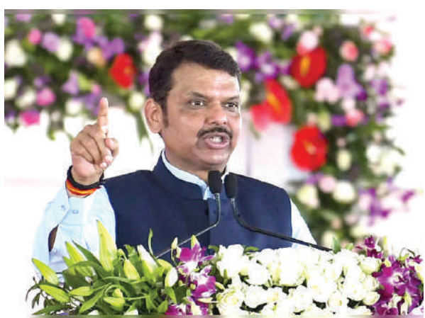
यांच्यातर्फे आयोजित धापेवडा उपसा सिंचन टप्पा दोन भूमिपूजन कार्यक्रमाकरिता उपमुख्यमंत्री देवेंद्र फडणवीस गोंदिया जिल्ह्यात आले