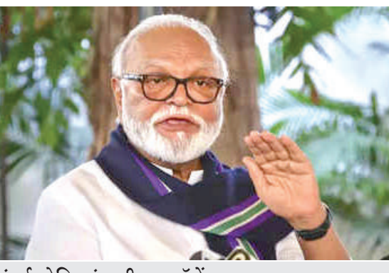
मुंबई पोलिसांसाठी एक चॅलेंज बाबा सिद्दिकी यांना अनेक वर्षांपासून ओळखत होते. त्यांना धमकी मिळाल्यानंतर वाय सुरक्षा देण्यात आली होती. पण फक्त सुरक्षा देऊन काही होत नाही. धमकी कोणी दिली याचा तपास करणे गरजेचे होते. भायखळा येथील तालुका प्रमुखांची देखील निष्णू हत्या झाली होती. या हत्या म्हणजे मुंबई पोलिसांसाठी एक चॅलेंज आहे, असे छगन भुजबळ म्हणाले. लावा. मात्र ही केवळ गृहमंत्र्यांची नाही तर मुख्यमंत्र्यांची देखील जबाबदारी आहे, असे भुजबळ म्हणाले. पुढे बोलताना भुजबळ म्हणाले, पोलिस खात्यात योजयप्रकारचे अधिकाऱ्यांची नेमणूक केली पाहिजे. योग्य अधिकारी कोण

प्रतिनिधी येवला राष्ट्रवादी काँग्रेस अजित पवार पक्षाचे नेते बाबा सिद्दिकी यांच्या हत्येवरून छगन भुजबळ यांनी सरकारला घरचा आहेर दिला आहे. बाबा सिद्दिकी यांच्या सुरक्षेची जबाबदारी फक्त गृहमंत्र्यांची नाही तर मुख्यमंत्र्यांची देखील आहे, असे भुजबळ म्हणाले. बाबा सिद्दिकी यांच्या हत्येनंतर विरोधकांकडून सरकारवर टीकेची झोड उठवली जात आहे. अशात छगन भुजबळ यांनीही सरकारला घरचा आहेर दिला आहे. पोलिसांना फ्री हँड दिला पाहिजे, अशी सूचना देखील भुजबळ यांनी दिली आहे. ते नाशिकच्या येवल्यामध्ये प्रसारमाध्यमांची बोलत होते. छगन भुजबळ म्हणाले, बाबा सिद्दिकी यांची हत्या कॉन्ट्रॅक्ट किलिंग आहे. 10-12 हजारांत पोरं हत्या करतात. पोलिसांना फ्री हँड दिला पाहिजे. मी तुमच्या पाठीमागे उभा राहिल. तुम्ही काय करतात हे मी विचारणार नाही. पण जे कोणी गुन्हेगार आहेत, त्यांची विल्हेवाट