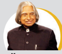
- डॉ. अब्दुल कलाम

संकुचित ध्येय बाळगू नका. महान विचारदृष्टी समोर ठेऊन परिश्रम केले तर आपला देश निश्चितपणे एक विकसित राष्ट्र बनेल.