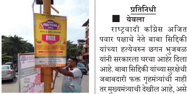
हटविण्याच्या विशेष मोहिमे दरम्यान मोठे हॉर्डिंग/बैनर, कि.ऑस्क.युनिपोल हॉर्डिंग/वीज/दूरधनी/सिमल चे खांब यावरील) बॅन्ड, झाडावरील खांब पोस्टर्स, कॅम्पे, अनधिकृत लाईटच्या माळा, रस्त्यामधील मंडप, डिझायडर मध्ये उभे केलेले कटाउट्टर, इतर फलक काढण्यात येत आहेत. तुयाराच्या सत्रात खारघर प्रभाग अ मध्ये सुमारे 44 व नावडे उषविभागामध्ये 34 बेकायदेशीर फलक काढण्यात आले, पनवेलमध्ये 56 अनधिकृत फलक काढण्यात आले, प्रभाग समिती कामोठे अंतर्गत 18 पोस्टर, 73 बॅनर, 6 कमाना यांच्यावर दुपार पर्यंत कारवाई करण्यात आली तसेच कळंबोलीमध्ये सुमारे 150 अनधिकृत फलक काढण्यात आले.