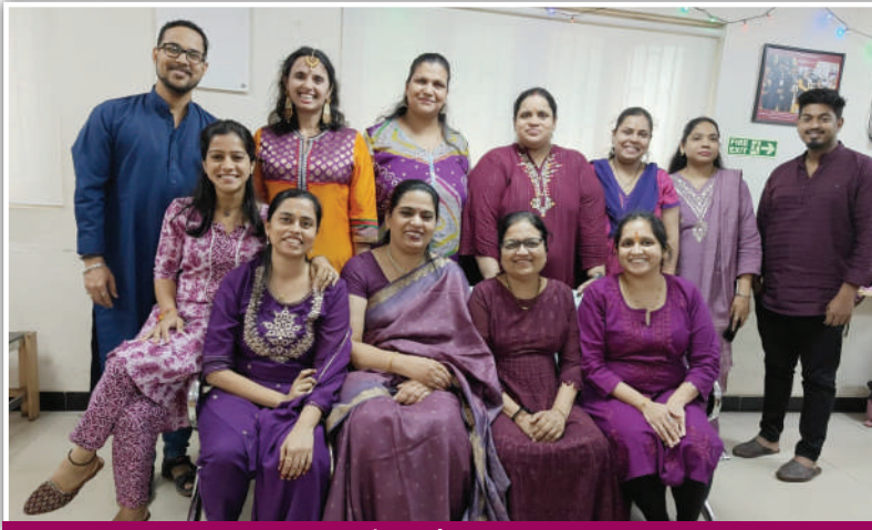
एनकेजीएसबी बँक दिंडोशी शाखेचे कर्मचारी.