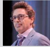
- रॉबर्ट डायनी ज्यु. हॉलीवूड अभिनेता

तुम्ही जिंकल्यावर कोण टाळ्या वाजवत नाहीत यावर बारकार्डने लक्ष द्या. तुम्हाला लवकरच तुमचे खरे मित्र दिसायला सुरवात होईल.