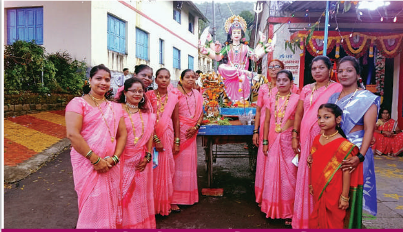
आई एकविरा महिला मंडळ, हाशिवरे, ता. अलिबाग