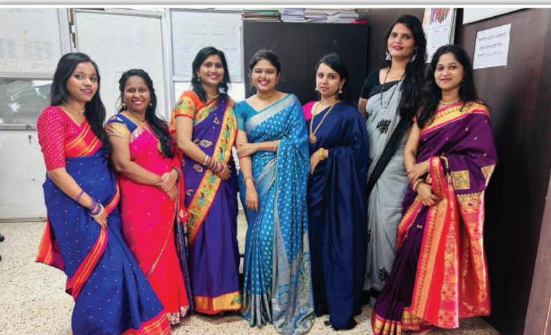
केपूर्व मनपा कार्यालय, आरोग्य खाते