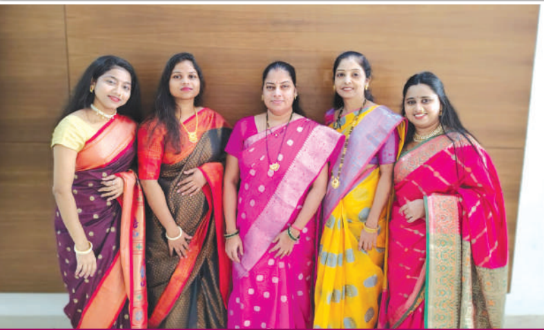
वरळी, बीडीडी म्हाडा स्टाफ