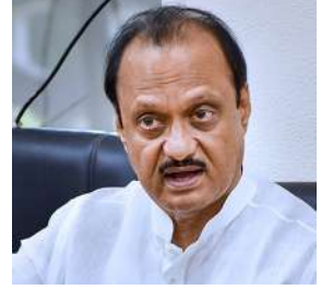
करुण हल्लेखोरांवर कडक कारवाई करण्यात येईल. हल्ल्यामागच्या सूत्रधारही शोधण्यात येईल, असेही अजित पवार म्हणाले.

राष्ट्रवादी कॉंग्रेसचे नेते, माजी राज्यमंत्री, विधिमंडळात प्रदीर्घकाळ राहिलेले माझे सहकारी बाबा सिद्दीकी यांच्यावर झालेल्या गोळीबाराची घटना अत्यंत दुर्दैवी निषेधार्थ आणि वेदनादायी आहे. या घटनेत त्यांचे निधन झाल्याचे समजून मला धक्का बसला. मी माझा चांगला सहकारी, मित्र गमावला आहे. या म्हाड हल्ल्याचा मी तीव्र शब्दात निषेध करतो. अशा शब्दात उपमुख्यमंत्री अजित पवार यांनी माजी राज्यमंत्री बाबत सिद्दीकी यांच्या निधनाबद्दल दुःख व्यक्त करून श्रद्धांजली वाहिली. या घटनेची सखोल चौकशी