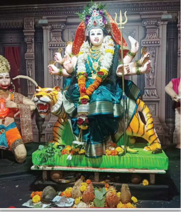
गोंधळपाडा, गावदेवी मंडळ, अलिबाग.