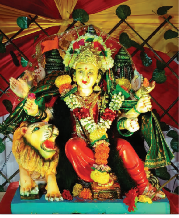
ऑंकार ऑर्चिड, कामोटे, सेक्टर २० येथील माता भवानी.