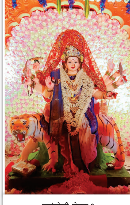
कळंबोली, सेक्टर १०