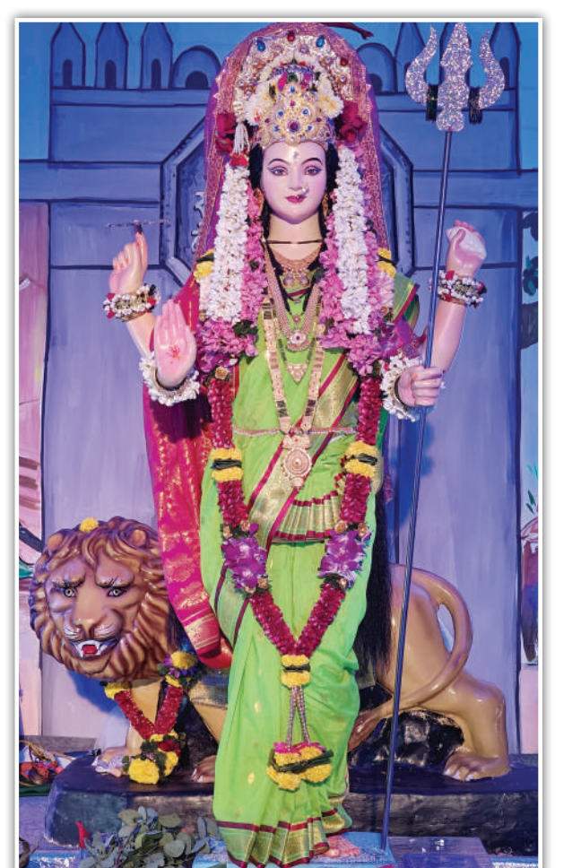
प्रभातची माताप्रभात मित्र मंडळ, प्रतिक्षाणगर, सायन कोळीवाडा, मुंबई