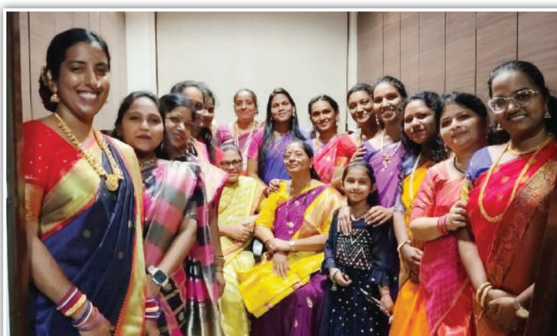
हिल्डन पॅकेजिंग प्राव्हेट लिमिटेड, अंधेरी