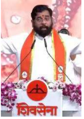
असा जाणार नाही. मला हलक्यात घेऊ नका, असे त्यांनी विरोधकांना ठणकावून सांगितले.

चारही बाजूंनी लोक येत आहेत. याठिकाणी भगवा उत्साह संचारल्याचे ते म्हणाले. खरं म्हणजे, महाराष्ट्र विरोधी आघाडीला घरी पाठवून आपलं सरकार आलं. तेव्हा काही लोक म्हणत होते. हे सरकार 15 दिवस टिकणार नाही. एका महिन्यात पडेल. दुसऱ्या महिन्यात पडेल. सहा महिन्यात पडेल. पण टीका करणाऱ्यांना हा एकनाथ शिंदे पुरून उरला. जनतेच्या आशीर्वादाने आणि साथीने घासून नाही तर ठासून दोन वर्षे पूर्ण केली. कारण मी बाळासाहेबांचा शिवसैनिक आणि आनंद दिघे साहेबांचा चेला आहे.