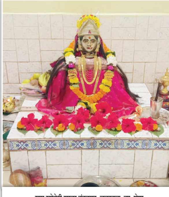
सप्त सोनेरी माता इंद्रनगर, वडखळ, ता. पेण