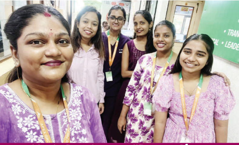
बोरिवली पश्चिम येथील अपेक्स हॉस्पिटलच्या नर्सिंग स्टाफ