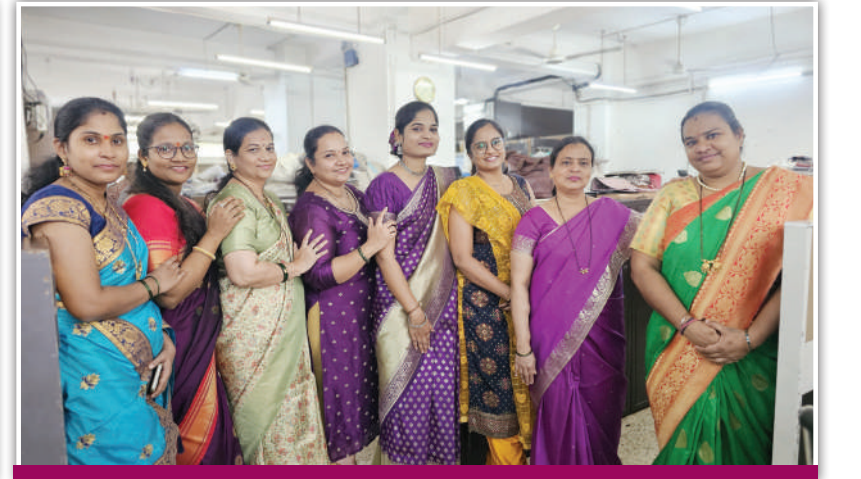
के/पूर्व मनपा विभाग, परिरक्षण खाते.