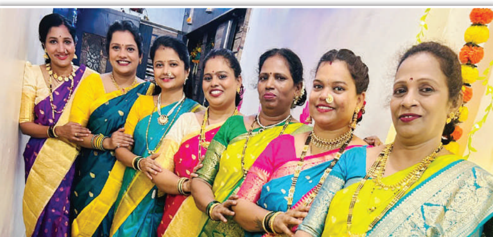
लक्ष्मीनारायण सोसायटी, इमामवाडा. सॅंडहस्ट्रीट.