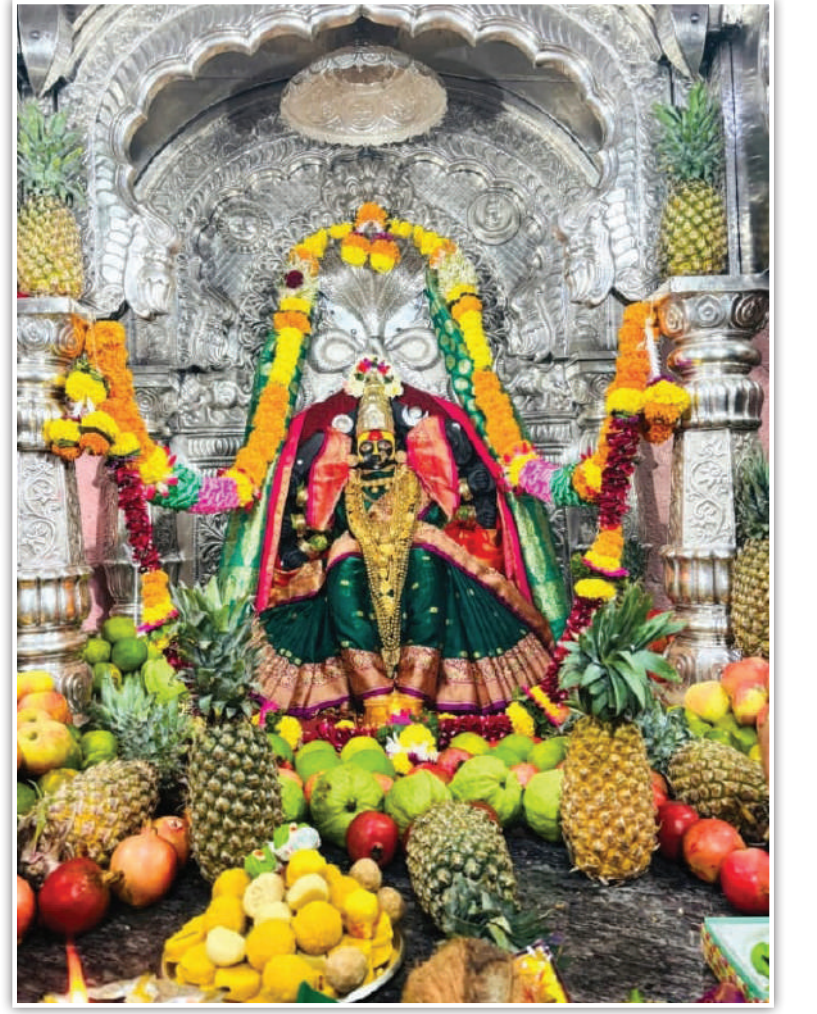
किल्ले प्रतापगड आई भवानी