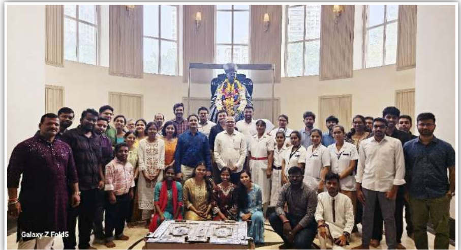
पूर्वीपासूनची आहे. याच दिवशी देवीने महिषासुर या राक्षसाचा वध केला. प्रभू रामानेही याच दिवशी रावणाचा वध केला. पांडव अज्ञातवासात राहण्याकरिता ज्या