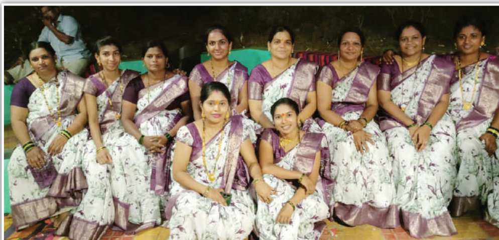
सप्त सोनेरी माता महिला मंडळ इंद्रनगर, वडखळ