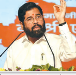
कोसळला ही अतिशय वाईट आणि दुःखद घटना आहे. आमच्यासाठी ही अत्यंत संवेदनशील बाब आहे. तमाम महाराष्ट्रातील शिवभक्त या घटनेने

शिवराय आमच्या अस्मितेचा विषय, पण विरोधकांचे राजकारण दुर्दैवी