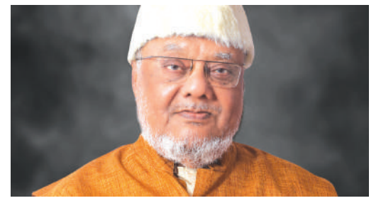
'तमाशा कलावंताचा आधारवड' जुन्नरचे 'नेराळे'