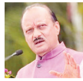
विधानांमुळे अजित पवारांनी मुख्यमंत्री एकनाथ शिंदे आणि उपमुख्यमंत्री देवेंद्र फडणवीस यांच्याकडे नाराजी व्यक्त केली आहे. नागपूरच्या रामगिरी येथे

प्रतिनिधी नागपूर विधानसभा निवडणुकीच्या अनुषंगाने महाराष्ट्रातील राजकीय वृत्तळात हालचाली सुरू झाल्याचे दिसत आहे. महाविकास आघाडीने सरकारला अनेक मुद्द्यांवरून घेरण्यास सुरुवात केली आहे. तर दुसरीकडे महायुतीमध्ये मात्र अंतर्गत वाद सुरू असल्याचे गेल्या काही दिवसांपासून दिसत आहे. भाजप आणि राष्ट्रवादी काँग्रेस अजित पवार गटातील अंतर्गत वाद आता लपून राहिलेला नाही. याच पार्श्वभूमीवर उपमुख्यमंत्री अजित पवारांनी थेट इशाराच दिला आहे.