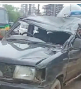
टँकरवरने पाठमागून जोरदार धडक दिली, हा अपघात इतका भीषण होता की त्यामध्ये टेम्पो ट्रॅक्टरच्या समोरील भागाचा चुराडा झाला आहे.

मुंबईच्या आर.सी.एफ.पोलिस स्टेशनच्या हद्दीत भीषण अपघात झाला आहे. मिळालेल्या माहितीनुसार, दुपारी 1.50 च्या सुमारास गवहापाडा-शंकर देव रस्त्यावर क्वालिंस गाडीच्या चालकाचा नियंत्रण सुटून गाडी पलटी होत येत एका टँकरवर धडकली. या गाडीत एकूण सहा प्रवासी होते व सर्व एकाच परिसरातील रहिवासी आहेत. या अपघातात तिघांचा दुर्दैवी मृत्यू झाला असून तिघे भीषण जखमी आहेत. जखमींना तातडीने जवळच्याच रुग्णालयात उपचारासाठी दाखल करण्यात आले असून त्यांच्यावर उपचार सुरू आहेत.