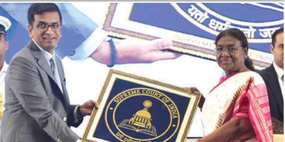
मुर्मू म्हणाल्या की, न्यायालयांमध्ये तात्काळ न्याय मिळण्यासाठी खटल्यांची सुनावणी पुढे ढकलण्याची संस्कृती संपवली पाहिजे. त्यासाठी

न्यायपालिकेच्या राष्ट्रीय परिषदेच्या समापन कार्यक्रमाला उपस्थिती लावली. यावेळी त्या बोलत होत्या. सरन्यायाधीश डीवाय चंद्रचूड आणि केंद्रीय कायदा व न्याय राज्यमंत्री (स्वतंत्र प्रभार) अर्जुन राम मेघवाल हेही या कार्यक्रमाला उपस्थित होते. या कार्यक्रमात मुर्मू यांच्या हस्ते सर्वोच्च न्यायालयाच्या ध्वजाचे आणि चिन्हाचे प्रकाशनही करण्यात आले. या कार्यक्रमात राष्ट्रपती मुर्मू यांनी सर्वोच्च न्यायालयाच्या ध्वजाचे प्रकाशन केले.