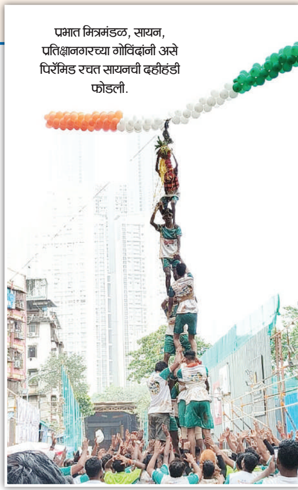
पमात मित्रमंडळ, सायन, प्रतिक्षणगरच्या गोविंदांनी असे पिरॅमिड रचत सायनची दहीहंडी फोडली.