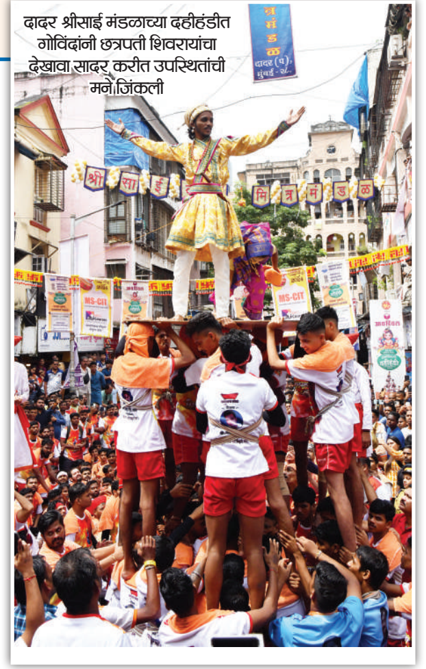
दादर श्रीसाई मंडळाच्या दहीहंडीत गोविंदांनी छत्रपती शिवायांचा देखावा सादर करीत उपस्थितांची मनोरंजितली