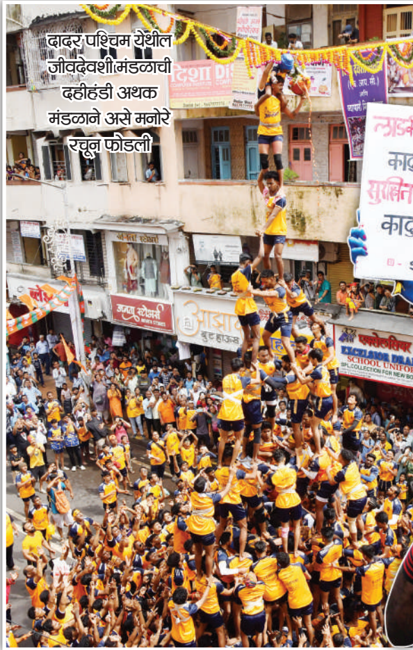
दादर पश्चिम येथील जीवदेवशीर्मा मंडळाची दहीहंडी अथक मंडळाने असे मनोरे रचून फोडली