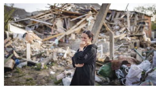
युक्रेन युद्धात 6 लाख रशियन सैनिकांचा मृत्यू

मराठी अस्मितेचा आवाज बुलंद करण्याचे कार्य गेली २७ वर्षे करणारे 'दैनिक वृत्तमानस' आता घरोघरी पोचवण्याचे काम आम्ही करणार आहोत. वाचकांना आमच्या लोकप्रिय दैनिकाची प्रत उपलब्ध होत नसेल तर या दूरध्वनीवर संपर्क साधावा. दातार अँड सन्स न्युज पेपर डिस्ट्रिब्युटर्स भ्रमणध्वनी - ८६५५१९४४५२, ८५९१६६२६१६, ९८६७३०८०६३