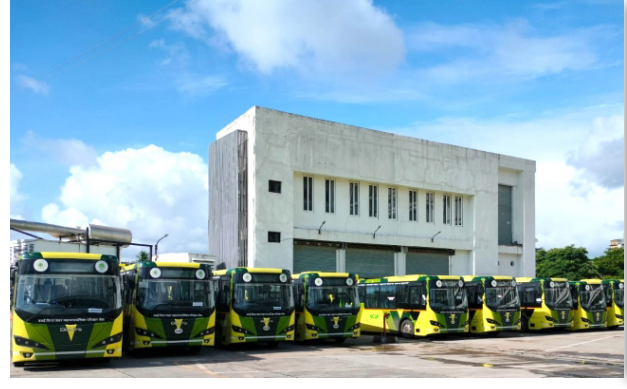
आहे. जिथे ४० इलेक्ट्रिक बसेस आणि ९० डिझेलवर चालणाऱ्या ठेकेदाराच्या बसेस व्यवस्थापित केल्या जात आहेत. परंतु वाढत्या

प्रतिनिधी ■ वसई वसई-विरार महानगरपालिकेच्या परिवहन विभागात मोठा बदल घडत असून, लवकरच १०० नव्या इलेक्ट्रिक बसेस सेवेत दाखल होणार आहेत. सध्या ४० इलेक्ट्रिक बसेस शहरातील नागरिकांसाठी उपलब्ध आहेत. नव्या बसेसच्या आगमनासाठी नवघर आणि नालासोपारा येथे बस आगारांच्या विकासकामांना गती देण्यात आली आहे.