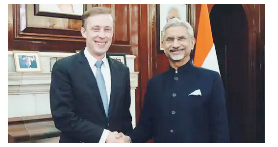
अमेरिकेने 3 भारतीय आण्विक संस्थांवरील बंदी उठवली

म ह त्वा चे बदमाश कंत्राटदारांमुळे गोवा हायवे रखडला