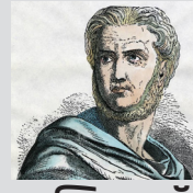
- पब्लियस कॉर्नेलियस टॅसिटस रोमन इतिहासकार