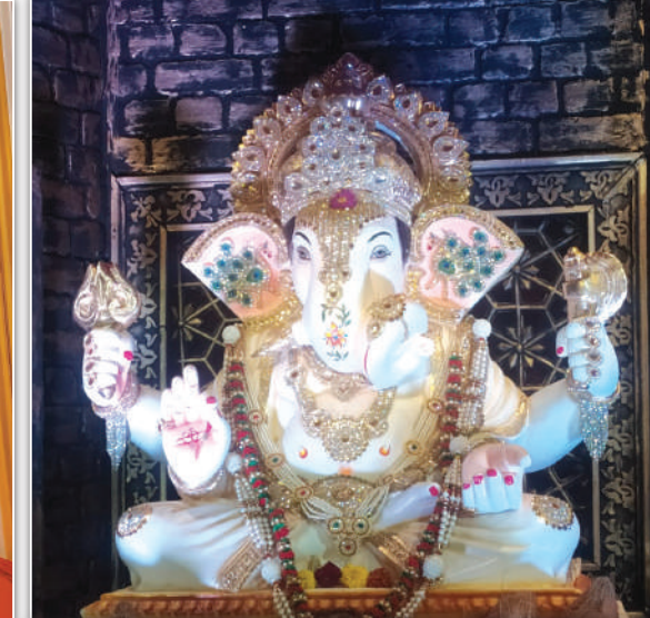
आनंद नगर उत्सव समिती, सार्वजनिक गणेशोत्सव, दहिसर (पूर्व) वर्ष १४ वे