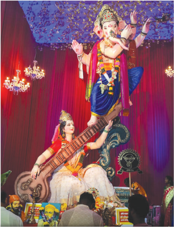
शिवनगर सार्वजनिक गणेशोत्सव मंडळ एन दत्तामार्ग, अंधेरी पश्चिम यांची २२ फूट उंच गणेश मूर्ती.