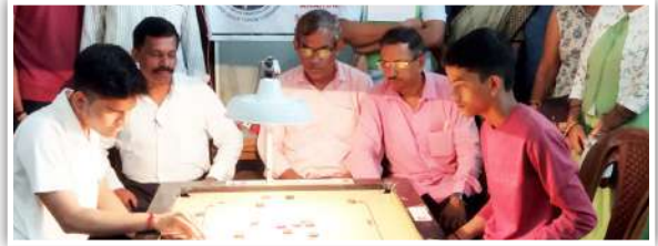
को-ऑप. बँक एम्प्लॉईज युनियन, मुंबई व माहीम ज्युवेनील स्पोर्ट्स क्लब सहकार्याने माजी केंद्रीय राज्य अर्थमंत्री आनंदराव अडसूल यांच्या