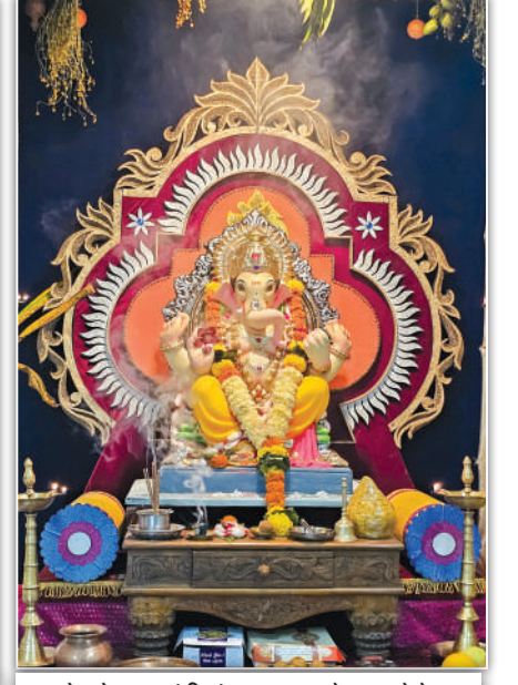
पेडणेकर कुटुंबीयांचा मालवण देवबाग येथे विराजमान असलेला गणपती बाप्पा