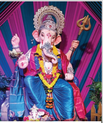
घाटकोपर पश्चिम जय संतोषी माता विकास मंडळाच्या गोळीबारच्या राजाची मंगलमूर्ती. यंदा मंडळाचे ४४ वर्ष साजरे होत आहे.