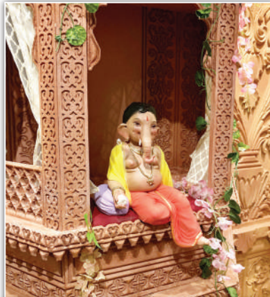
न्यू दिडोशी स्वामी समर्थ म्हाडा गणेशोत्सव मंडळाची सुंदर महालात विराजमान १२ इंचाची बाल गणेशमूर्ती. मूर्तिकार - श्रेयस सुथळे