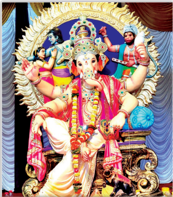
शक्ती एस.आर.ए. सोसायटी, भाबरेकरनगर, चारकोप, कांदिवली (प.) येथे प्रतिष्ठापित गणरायाची सुंदर मूर्ती.