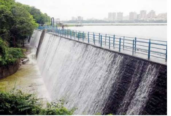
एकूण सात तलावांपैकी ४ तलाव जुलै महिन्यात भरले आहेत. उर्वरित अप्पर वेतणा, मध्य वेतणा आणि भातसा हे तीन तलाव

प्रतिनिधी मुंबई गणे शीतलसवात मोठा पाऊस पडून सर्व तलाव भरून वाहू लागली असता अंदाज होता. पण तसे घडले नाही. पण तलाव क्षेत्रात थोडाफार पाऊस होत असल्याने काल सकाळी ६ वाजेपर्यंत मुंबई ला पाणी पुरवठा करणाऱ्या तलावांमध्ये ९८.७१ टक्के पाणी साठा जमा झाला आहे. हा पाणीसाठा गेल्यावर्षी पेक्षा वाढला आहे. गेल्यावर्षी याच दिवशी ९६.९८ टक्के पाणी साठा जमा झाला होता.