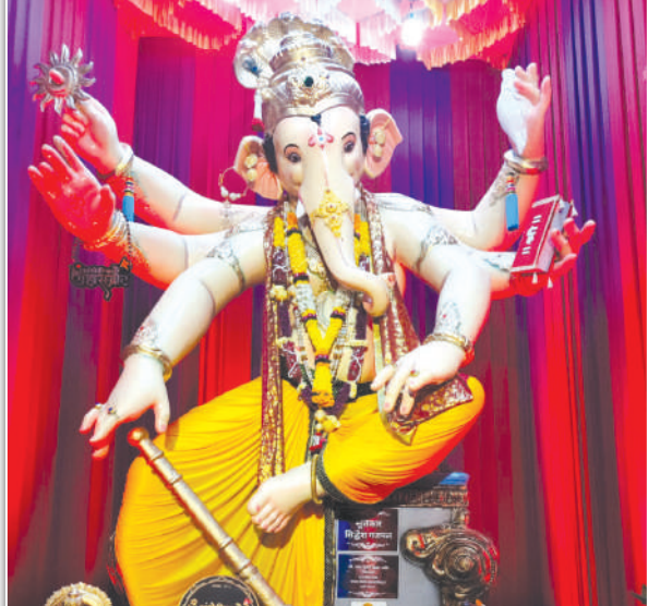
अंधेरीचा महासम्राट - श्री गणेश मित्र मंडळ सार्वजनिक गणेशोत्सव, गणेश नगर, एन दत्ता मार्ग, अंधेरी पश्चिम