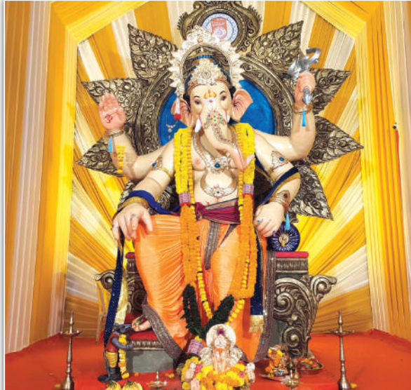
नव तरुण सेवा मंडळ, सर्वात उंच मूर्ती, 'कालिनाचा इच्छापूर्ती गणेश'