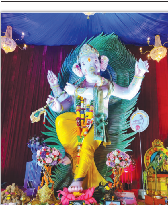
अंधेरीचा वरदविनायक - सार्वजनिक गणेशोत्सव मंडळ, इंदिरा नगर आणि परिसर, भाई भगत मार्ग, अंधेरी पश्चिम