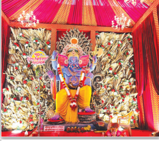
टेपटिहलेज सार्वजनिक उत्सव मंडळ, अन्धेरी (प.) यांचा श्री गणराय, वर्ष ५० वे