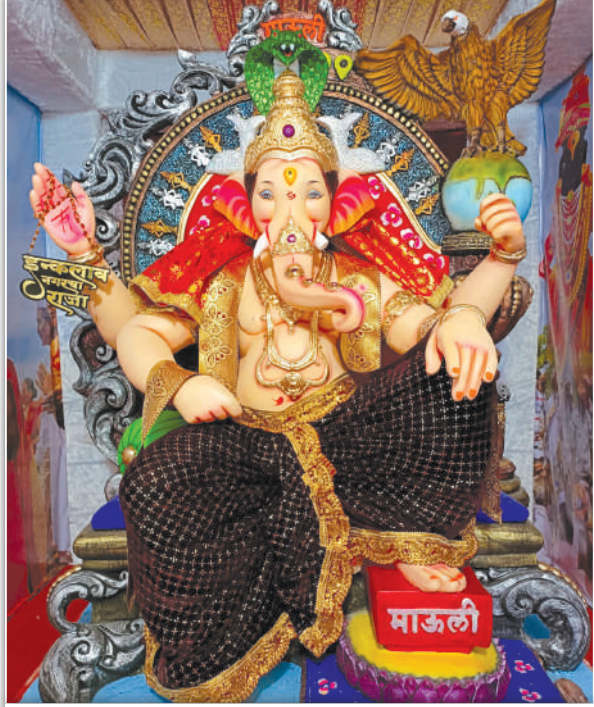
इन्कलाबनगर सार्वजनिक गणेशोत्सव मंडळ, जोगेश्वरी पूर्व, मंडळाचे यंदाचे ४३ वे वर्ष आहे.

मागणी करण्यात आली आहे. पुणे रेल्वे स्थानकाची जागा अपुरी पडत असल्यामुळे पुढील काळात ऊरुळी कांचन येथे भव्य हार्बर टर्मिनल उभे करण्याबाबतचा आराखडा करण्यात आला असून लवकरच याबाबत कार्यवाही सुरू होईल, असेही ते म्हणाले. मंत्री चंद्रकांत (दादा) पाटील म्हणाले, ही रेल्वेच्या महाराष्ट्राच्या इतिहासात ऐतिहासिक घटना आहे. पुणे- कोल्हापूर आणि पुणे- हुबळी वंदे भारत ट्रेन मुळे पश्चिम महाराष्ट्रातील पुणे ते कोल्हापूर पट्ट्याला मोठा फायदा होणार आहे. या पट्ट्यात प्रचंड सहकारी चळवळ, उद्योग, शैक्षणिक संस्था असल्यामुळे एकाच दिवसात कोल्हापूरहून पुणे आणि पुण्याहून कोल्हापूर असे कामकाज करून परत येणे शक्य होणार आहे. चांगला वेग, दिसायला आकर्षक, प्रवाशांना प्रवासाचा आनंद देणारी आणि उच्च दर्जाचे खाद्यपदार्थ असलेली ही रेल्वे आहे, असेही त्यांनी सांगितले.