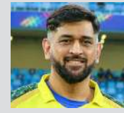
- महेंद्रसिंग धोनी माजी कर्णधार

माझे ध्येय इतर कोणापेक्षाही सरस किंवा अधिक चांगले होण्याचे नाही तर मी स्वतः जसा आहे त्यापेक्षा आणखी कुशल आणि सर्वोत्तम होण्याचा प्रयत्न करत असतो.