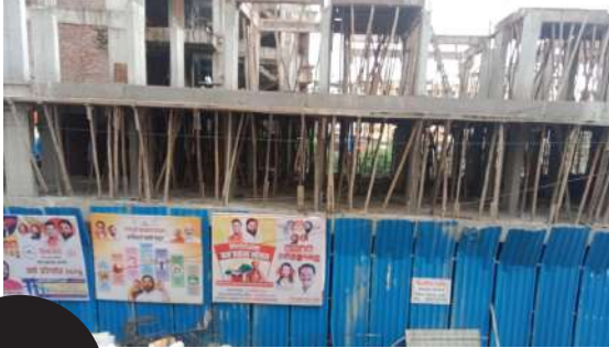
दिव्या आगासन रोड ग्लोबल शाळा आणि दिवा पोलिस, वीट क्रमांक 4 समोरच बांधकाम

विशेष म्हणजे हे सगळी बांधकाम विनधास्त चालू आहेत. भावडे दिवेकर या गोड गैरसमजुतीत आहेत कि दिव्याचा विकास होणार? पण खरं तर विकास