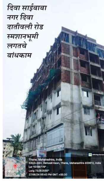
दिव्या प्रभागातील लोकसंख्या भरमसाठ वाढत असून त्यामुळे पायाभूत सुविधांवर ताण निर्माण झाला आहे. पिण्याचे पाणी, नाले, गटारांची व्यवस्था, रस्त्यांची कामे,