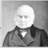
- जॉन क्विन्सी अॅडम अमेरिकेचे माजी राष्ट्रपती

जर तुमच्या कृतीमुळे कोणी महत्त्वाकांक्षी होत असेल किंवा काही करण्यासाठी इच्छा होत असेल तर तुम्ही उत्तम नेते आहात.