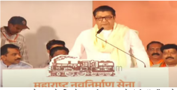
राज ठाकरे म्हणाले, शिवसेना आणि धनुष्यबाण चिन्ह ही एकनाथ शिंदेची, उद्धव ठाकरेची प्रॅपटी नाही. ती बाळासाहेबांची प्रॅपटी आहे. त्यांच्यावर तुम्ही कसला दावा सांगताय?

प्रतिनिधी डोंबिवली महाराष्ट्र नवनिर्माण सेनेचे प्रमुख राज ठाकरेनी डोंबिवलीमध्ये जाहीर सभा घेत प्रचाराचा नारळ फोडला. या सभेत महाराष्ट्रातील पक्ष फोडाफोडीच्या राजकारणावर राज ठाकरेनी जोरदार टीका केली. ही टीका करत असताना मूळ शिवसेना आणि राष्ट्रवादी काँग्रेस पक्ष कोणाचा? हे राज ठाकरेनी सांगितले.