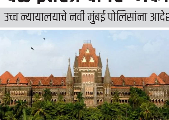
उच्च न्यायालयाचे नवी मुंबई पोलिसांना आदेश