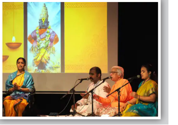
पुणे: भक्तांप्रती असलेला मातृत्वभाव, भक्तीयोगात प्राप्त केलेले उच्च स्थान, सामान्य जीवांना परब्रह्माचे दर्शन घडविण्याची आध्यात्मिक तयारी असणाऱ्या आदिशक्ती मुक्ताबाईचा अलौकिक जीवनप्रवास 'ब्रह्मचिक्ला मुक्ताई' या कार्यक्रमातून उलगडला.