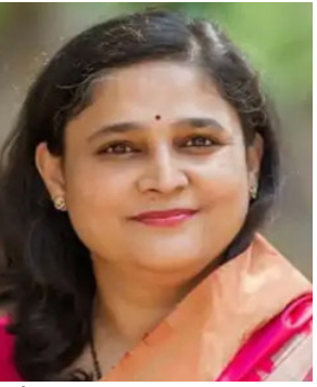
सोडणार नाही, असा इशारा