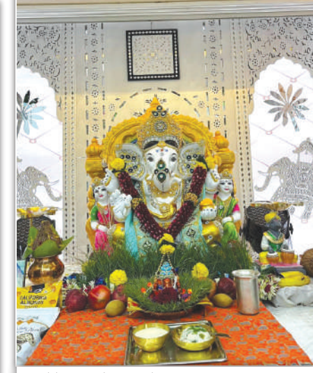
गोरेगाव पूर्वेतील दोशी कुटुंबाचा गणपती, यंदाचे २५ वे वर्ष