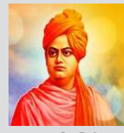
- स्वामी विवेकानंद