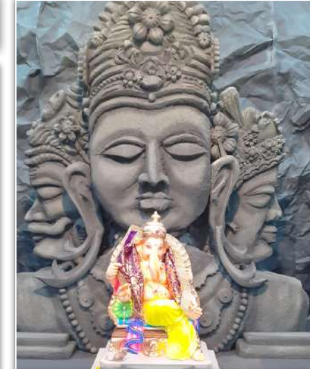
114 वा श्री गणेशोत्सव श्री आनंद भारती समाज, ठाणे. सजावटकार सुभाष शाक्यववार