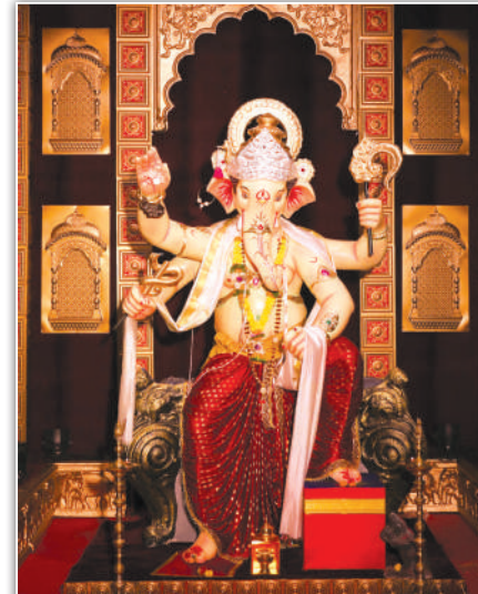
बाळ गोपाळ मित्र मंडळ (जी.टी.बी हॉस्पिटल शिवडी, 64 वे वर्ष, मूर्तिकार - अनिकेत शेवाळे