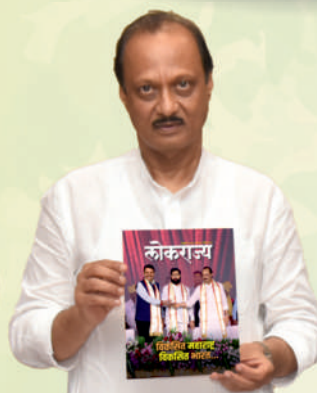
अजित पवार उपमुख्यमंत्री

चला स्वच्छतेच्या कार्यात सहभागी होऊया...महाराष्ट्र स्वच्छ ठेवण्यासाठी हातभार लावूया!!