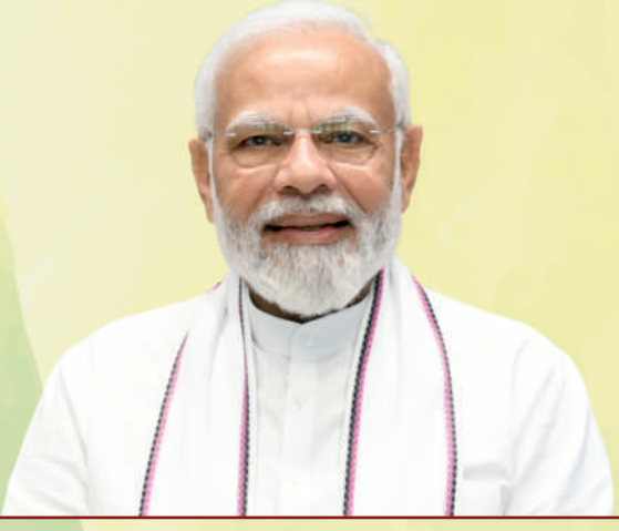
नरेंद्र मोदी पंतप्रधान