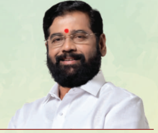
एकनाथ शिंदे मुख्यमंत्री