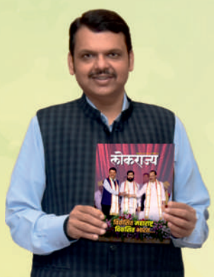
देवेन्द्र फडणवीस उपमुख्यमंत्री