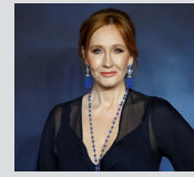
- जे. के. रेलिंग प्रसिद्ध लेखिका