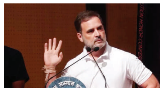
भाजप माझ्या नावाने खोटं पसरवत आहे

मराठी अस्मितेचा आवाज बुलंद करण्याचे कार्य गेली २७ वर्षे करणारे 'दैनिक वृत्तमानस' आता घोरोघरी पोचवण्याचे काम आम्ही करणार आहोत. वाचकांना आमच्या लोकप्रिय दैनिकाची प्रत उपलब्ध होत नसेल तर या दूरध्वनीवर संपर्क साधावा. दातार अँड सन्स न्युज पेपर डिस्ट्रिब्युटर्स भ्रमणध्वनी - ८६५५१९४४५२, ८५९१६६२६१६, ९८६७३२०८०६३