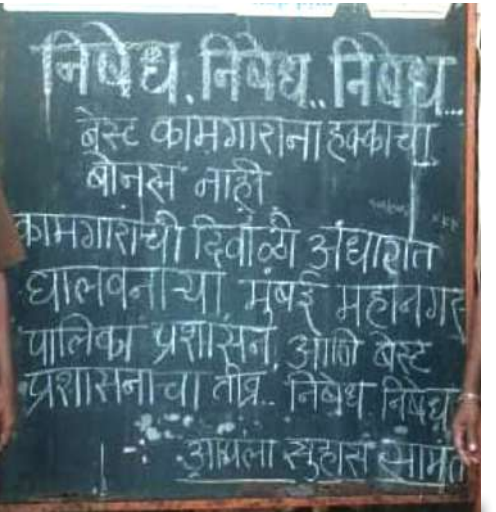
मुंबई: बेस्ट उपक्रमातील कामगाराना दिवाळीचा बोनस न दिल्यामुळे कामगारामध्ये असंतोष निर्माण झाला आहे... याचाच निषेध म्हणून बेस्ट कामगार सेना परिवाराकडून सर्व बेस्ट आगारत असे फलकादारे जाहीर निषेध करण्यात आला आहे.

मागणी नागरिकांकडून होत आहे. सणाच्या काळात बाजारपेठा ग्राहकांनी गजबजलेल्या आहेत. मात्र वीज पुरवठा खंडित झाल्याने व्यवसायिकांचे मोठे नुकसान होत आहे. तसेच नागरिकांनाही गैरसोयीचा सामना करावा लागत आहे. दिवाळी सणाच्या वातावरणात वीज पुरवठा सुरळीत ठेवणे गरजेचे होते. मात्र महावितरणच्या अधिकाऱ्यांना सणाच्या महत्त्वाचा विस्तर पडल्यासारखे वाटत आहे. परिणामी नागरिकांमध्ये आणि