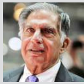
- रतन टाटा

लोखंडाचा नाश कोणीही करू शकत नाही, पण त्याचा स्वतःचा गंज त्याला नष्ट करू शकतो. त्याप्रमाणे, माणसाला कोणीही नष्ट करू शकत नाही, पण त्याची स्वतःची मानसिकता त्याला नष्ट करू शकते.