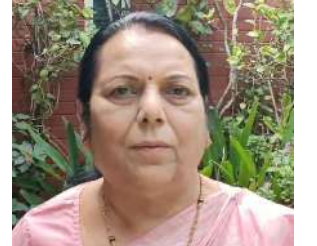
निवडणूक आयोजकाकडे खा. सावंत यांच्या विरोधात केली लेखी तक्रार