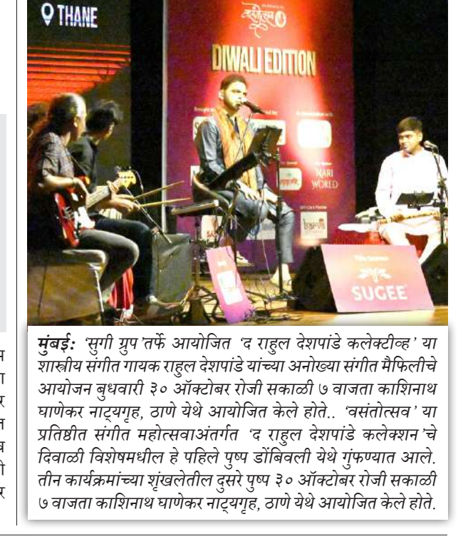
मुंबई: 'सुगी युप तर्फे आयोजित 'द राहुल देशपांडे कलेक्टीव्ह' या शास्त्रीय संगीत गायक राहुल देशपांडे यांच्या अनोख्या संगीत मैफिलीचे आयोजन बुधवारी ३० ऑक्टोबर रोजी सकाळी ७ वाजता काशिनाथ घाणेकर नाट्यगृह, ठाणे येथे आयोजित केले होते. 'वसंतोत्सव' या प्रतिष्ठीत संगीत महोत्सवांतर्गत 'द राहुल देशपांडे कलेक्शन' चे दिवाळी विशेषमहल हे पहिले पुष्प डॉबिबली येथे गुंफण्यात आले. तीन कार्यक्रमांच्या शृंखलेतील दुसरे पुष्प ३० ऑक्टोबर रोजी सकाळी ७ वाजता काशिनाथ घाणेकर नाट्यगृह, ठाणे येथे आयोजित केले होते.

दुसरीकडे दुरुस्ती मंडळाने ताडदेवमधील वसतिगृहाबाबत कोणतीही कार्यवाही केली नव्हती. त्यामुळे ताडदेवमधील वसतिगृह २०२१ पासून खडलेला आहे. आता मात्र दुरुस्ती मंडळाला जाग आली आहे. घरांनी दिलेल्या माहितीनुसार नोकरदार महिलांसाठीच्या म्हाडाच्या पहिल्या वसतिगृहाचा आराखडा तयार करून अंतिम करण्यात आला आहे. तर वसतिगृहाचा प्रस्तावही तयार झाला आहे. नोकरदार महिलांसाठी ताडदेवमध्ये बांधण्यात येणाऱ्या वसतिगृहाचा प्रस्ताव लवकरच प्रशासकीय मान्यतेसाठी राज्य सरकारकडे पाठवण्यात येणार असल्याचेही सूत्रांनी सांगितले.