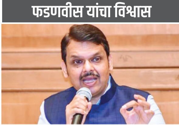
फडणवीस यांचा विश्वास

मानसिकता दर्शविली आहे. नक्कीच मला विश्वास आहे की आम्ही सर्वांनाच समजविण्यात यशस्वी होऊ असेही ते म्हणाले. आपल्या सुरक्षेत वाढ झाल्यासंदर्भात बोलताना त्यासंबंधी पोलिसांना माहिती आहे असे उतर दिले. आमचा प्रघात राहिला आहे की दिवाळीच्या दिवशी विभागीय कार्यालयामध्ये येतो. बरीच वर्षे आम्ही सर्व डबे घेऊन येतो आणि खातो. यात काही काळासाठी खंड पडला होता, पण मला आनंद आहे एकदा पुन्हा लक्ष्मीपूजाच्या निमित्ताने आज पुन्हा सगळ्यांच्या भेटी झाल्या.