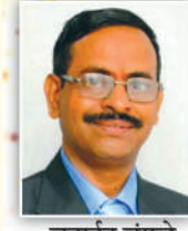
जनादेन जंगले अध्यक्ष