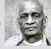
- सरदार वल्लभभाई पटेल