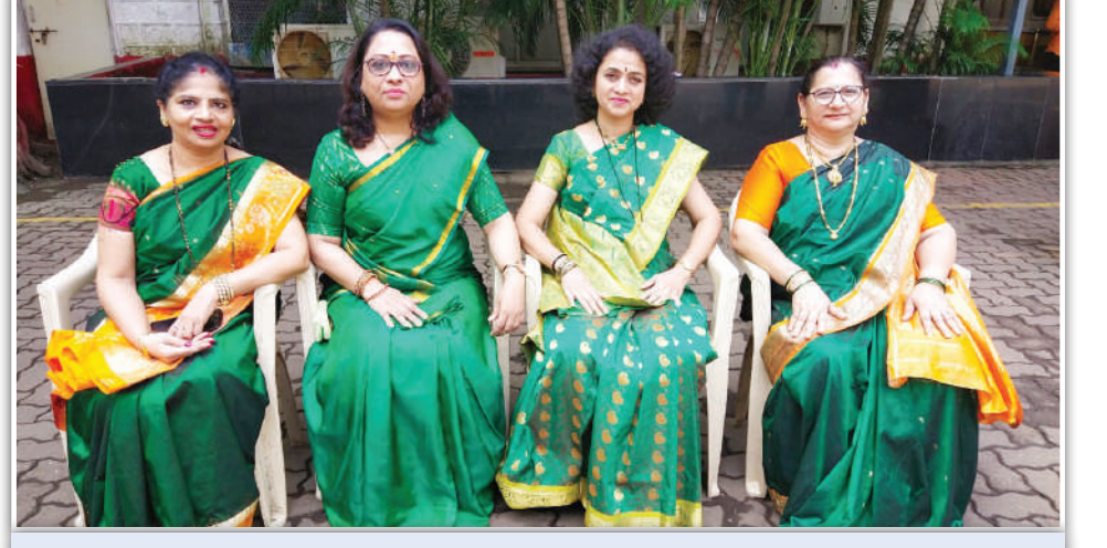
पश्चिम रेल्वे कार्यालय, लोअर परेल मिनिस्ट्रल स्टाफ