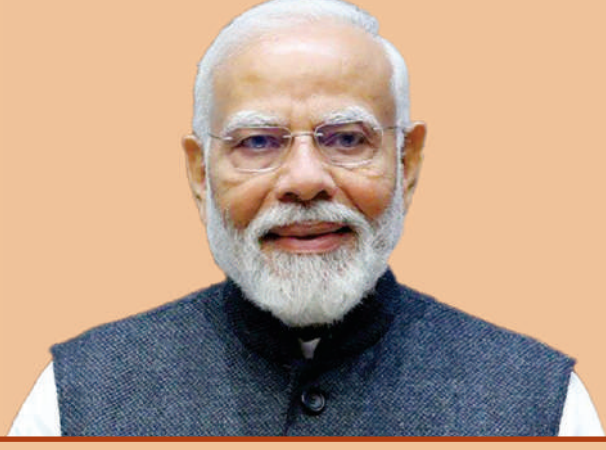
नरेंद्र मोदी प्रधानमंत्री

दैनिक "वृत्तमानस" साठी पाठविण्यात येणाऱ्या बातम्या आणि अन्य कार्यालयीन कामासाठी कृपया editorvm22@gmail.com या मेल वर पत्रव्यवहार करावा