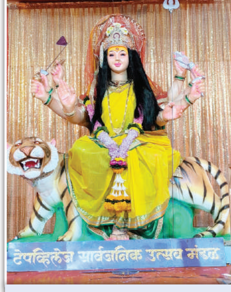
टेपव्हिलेज सार्वजनिक उत्सव मंडळ अन्धेरी (प) मुंबई ४०००५८