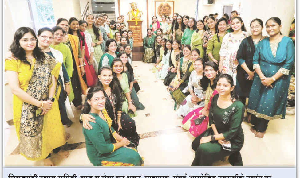
शिवजयंती उत्सव समिती, वस्तू व सेवा कर भवन, माझगाव, मुंबई आयोजित नवरात्रीचे नवरंग या उपक्रमांतर्गत दुसरा दिवस - रंग हिरवा.