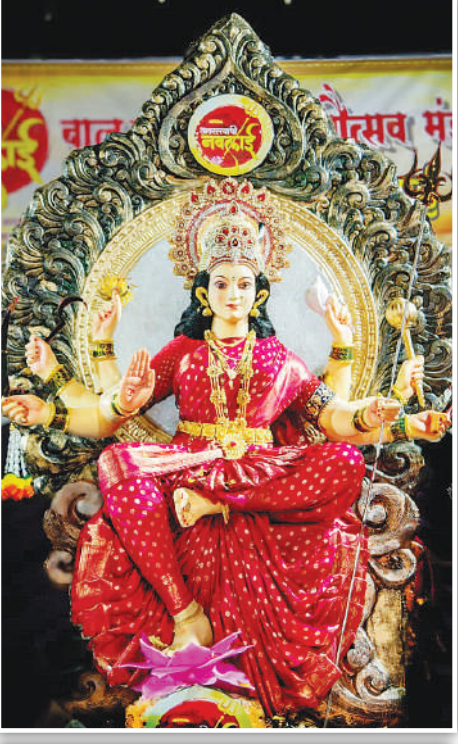
बाल उत्साही नवरात्रोत्सव मंडळ हेरंब हार्डट्स ईमारत, शाहीर अमर शेख मार्ग, सातरस्ता, मुंबई ४०००११