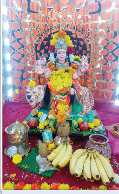
गोरेगाव (प.) येथील मोतीलाल नगर नं. 1 मधील 'त्रिकोणी मैदान मित्र मंडळ सार्वजनिक नवरात्री उत्सव' मंडळाचे 35वे वर्ष.