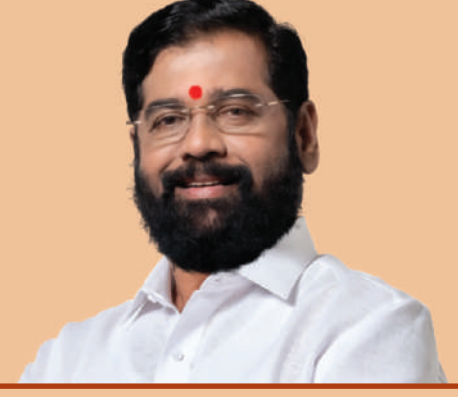
एकनाथ शिंदे मुख्यमंत्री