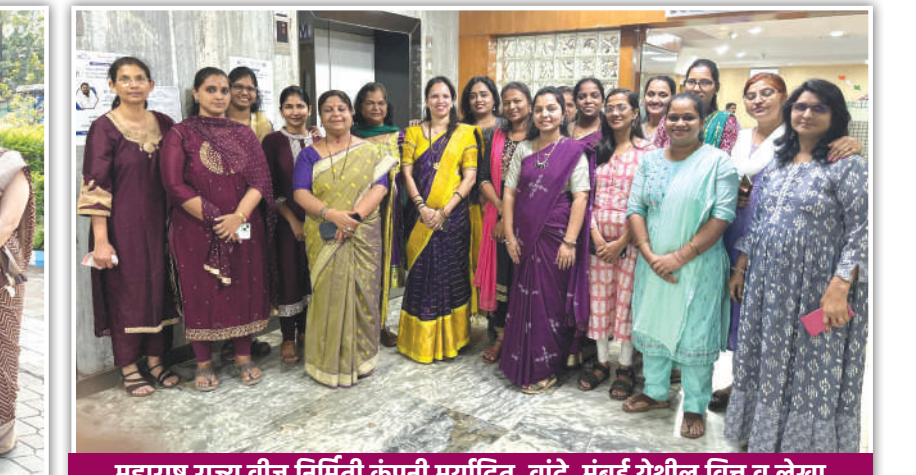
महाराष्ट्र राज्य वीज निर्मिती कंपनी मर्यादित, वांद्रे, मुंबई येथील वित्त व लेखा विभागात कार्यरत असलेल्या अधिकारी-कर्मचारी