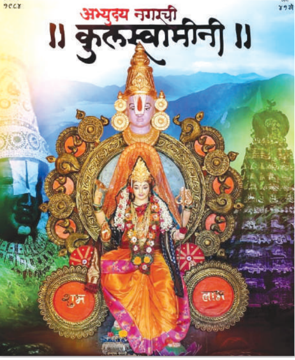
कुलस्वामीनी, तरुण मित्र नवरात्रोत्सव मंडळ, इमारत क्रमांक १०, ११ व ११ अ काळाचौकी

नवरात्री आणि दसऱ्याच्या मुहूर्तावर येणाऱ्या शिर्डीच्या श्री साईबाबांच्या १०६व्या जयंतीनिमित्त शिर्डी मंदिराच्या साई बालाजी प्रवेशद्वारावर नयनरम्य सजावट करण्यात आली आहे. हि अफलातन सजावट पाहण्यासाठी श्री साई भक्तांची मोठी गर्दी होत आहे. साईबाबा भक्त शिर्डीच्या साईबाबा ट्रस्टने बाबांच्या पुण्यतिथीनिमित्त केलेल्या सोयी-सुविधांचे आणि सजावटीचे मुक्त कंठाने कौतुक करीत आहेत.