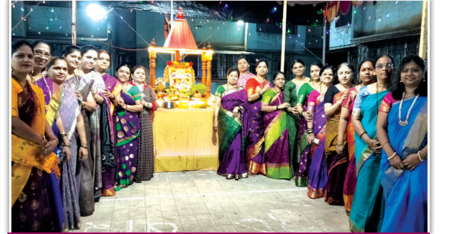
उषा सोसायटी साईकृपा कॉम्प्लेक्स काशिगाव, मीरारोड