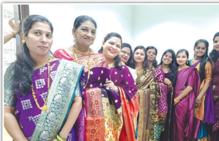
ज्युपिटर हॉस्पिटल, ठाणे