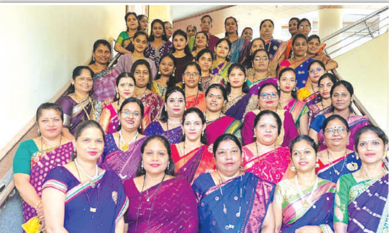
अंबरनाथ नगरपरिषद महिला कर्मचारी