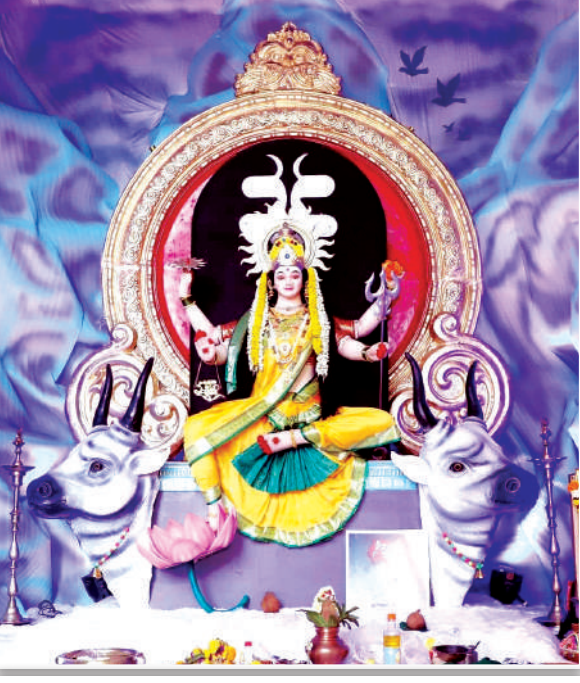
संभाजीनगर सार्वजनिक नवरात्रोत्सव मंडळ