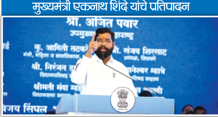
मुख्यमंत्री एकनाथ शिंदे यांचे प्रतिपादन

प्रतिनिधी ठाणे महाराष्ट्रातील सावत्र भाऊ लाडकी बहिण योजना बंद करण्याच्या मार्गावर असल्याची टीका, मुख्यमंत्री एकनाथ शिंदे यांनी केली आहे. मात्र, कोणीही 'माय का लाल' आला तरी योजना बंद पडणार नसल्याचे मुख्यमंत्री शिंदे यांनी म्हटले आहे. या माध्यमातून मुख्यमंत्री एकनाथ शिंदे यांनी उद्भव टाकरे यांच्यावर जोरदार हल्ला चढवला. पहिल्या अडीच वर्षात महाविकास आघाडीचे सरकारमधील कार्यकाळ पहा आणि मागच्या दोन सव्वा दोन वर्षात आमही केलेला कामाचा कार्यकाळ पहा. फरक तुम्हाला स्पष्ट दिसेल, असे आवाहन मुख्यमंत्री एकनाथ शिंदे यांनी केले आहे. राज्य सरकारच्या सर्व योजनांमध्ये आडवे येण्याचे काम विरोधक करत आहेत. मात्र त्यांना आडवे करण्याचे कामच जनता करणार असल्याचे मुख्यमंत्री