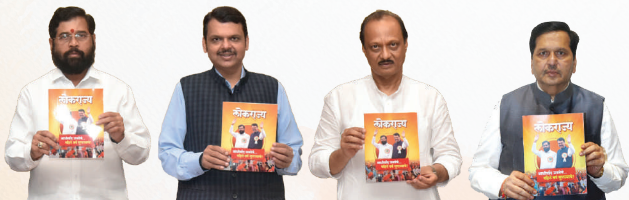
एकनाथ शिंदे मुख्यमंत्री