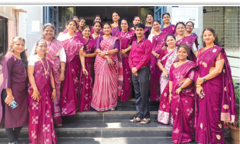
ईटिसी केंद्र वाशी विभागातील कर्मचारी