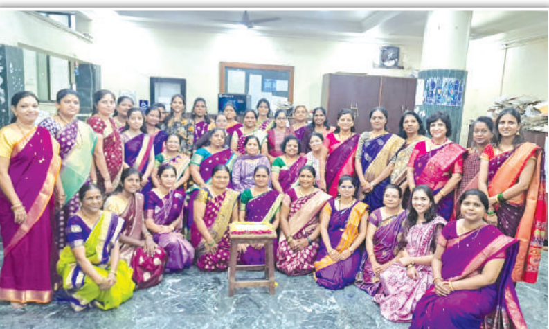
वरिष्ठ कोषागार अधिकारी, पुणे कार्यालयातील महिला अधिकारी/कर्मचारी