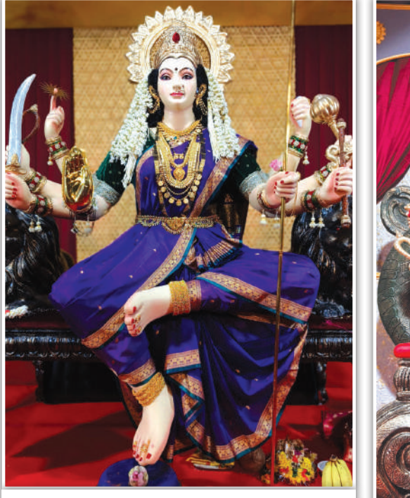
ग्रँट रोड (फॉर्जेट स्ट्रीट) येथील जय हरी ची जगदंबा आई भवानी