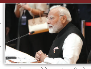
कायद्यांचे पालन करणे हे सगळ्यांच्याच हिताचे आहे. याच सोबत, इंडो पॅसिफिक हा प्रदेश सर्वसमावेशक आणि तणावमुक्त राहिल याबद्दल आपण प्रयत्नशील असले पाहिजे, असे म्हणत त्यांनी चीनला इशारा दिला आहे. विकासावादावर बाध करत, मोदी म्हणाले संयुक्त राष्ट्रांच्या समुद्राच्या कायद्यांचे पालन देवांनी करायला हवे जेणेकरून, सर्व देशांचे स्वातंत्र्य अबाधित राहील.

वृत्तसंस्था व्हिएट्निम "मी बुद्धांच्या भूमिंतून आलो आहे. आम्ही सातत्याने सांगतो की ही वेळ युद्ध करण्याची नाही. जागतिक समस्यांवरची उत्तर बुद्धभूमिवर मिळत नाहीत." असे प्रतिपादन पंतप्रधान नरेंद्र मोदी यांनी १९व्या पूर्व आशिया शिखर परिषदेत केले. लाओस येथील व्हिएट्निम या शहरात ते शुक्रवारी बोलत होते. सध्या पंतप्रधान, परिषदेनिमित्त लाओस येथे दोन दिवसांच्या दौऱ्यावर असून या दरम्यान अनेक आंतरराष्ट्रीय नेत्यांची भेट ते घेणार आहेत. परिषदेत आपल्या भाषणादरम्यान मोदी म्हणाले की जगाच्या पाठीवर आज वेगवेगळ्या ठिकाणी संघर्ष सुरू आहे. याचा सर्वाधिक फटका आशियातील दक्षिणेतील देशांना बसतो आहे. त्यामुळे आंतरराष्ट्रीय