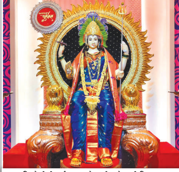
॥ विक्रोळीची दुर्गामाता ॥ मोरपंखी - मोरपंखी हिरवा हा या दिवसाचा रंग आहे. असे मानले जाते की भगवान शिवाच्या शरीराची एक बाजू देवी सिद्धिदात्री आहे. त्यामुळे त्यांना अर्धनारीश्वर या नावानेही ओळखले जाते. शास्त्रानुसार या देवीची उपासना करून भगवान शिवाने सर्व सिद्धी प्राप्त केल्या.