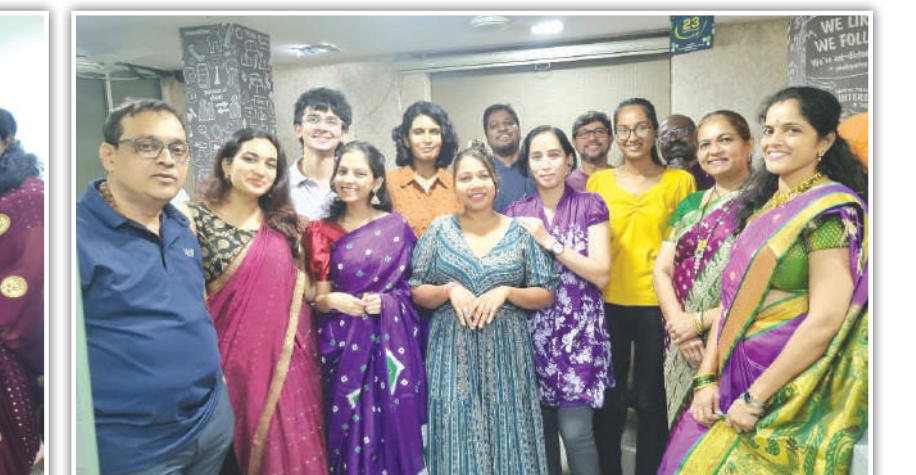
यज्ञ ब्रॅण्डस्केप्स प्रायव्हेट लिमिटेड, ठाणे कर्मचारीवर्ग