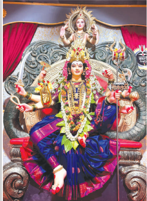
रामबागची माता राणी, अंधेरी (पू.)