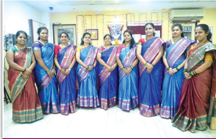
दादर सार्वजनिक वाचनालय, दादर महिला कर्मचारी वर्ग