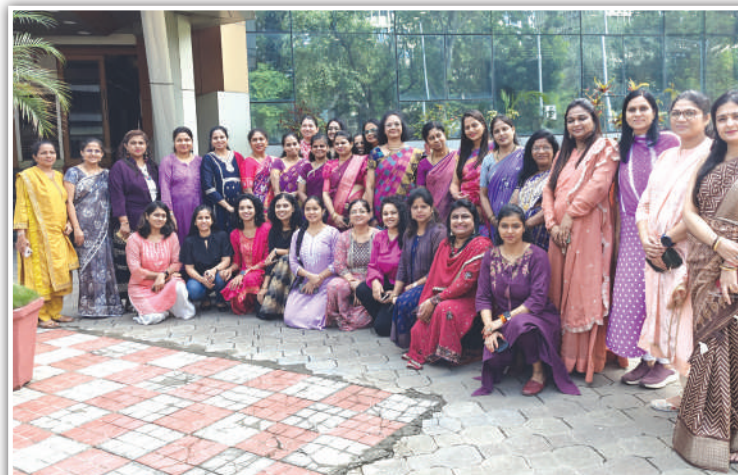
महाराष्ट्र राज्य विद्युत पारेषण कंपनी, (महापारेषण) सांघिक कार्यालय, वांद्रे