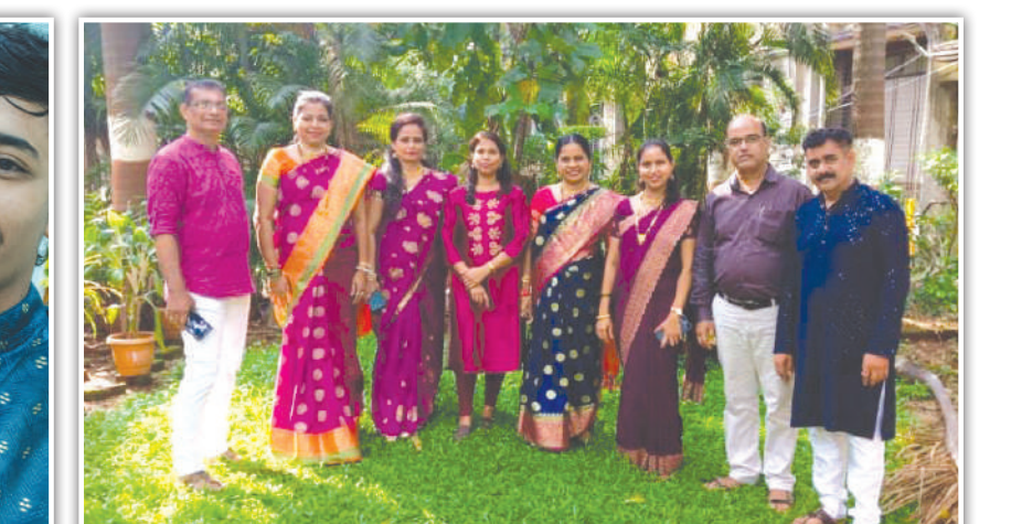
भायखळा इ वॉर्ड महापालिका कार्यालय