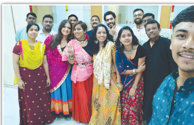
आकार अॅडव्हर्टायझिंग टीम, मुंबई