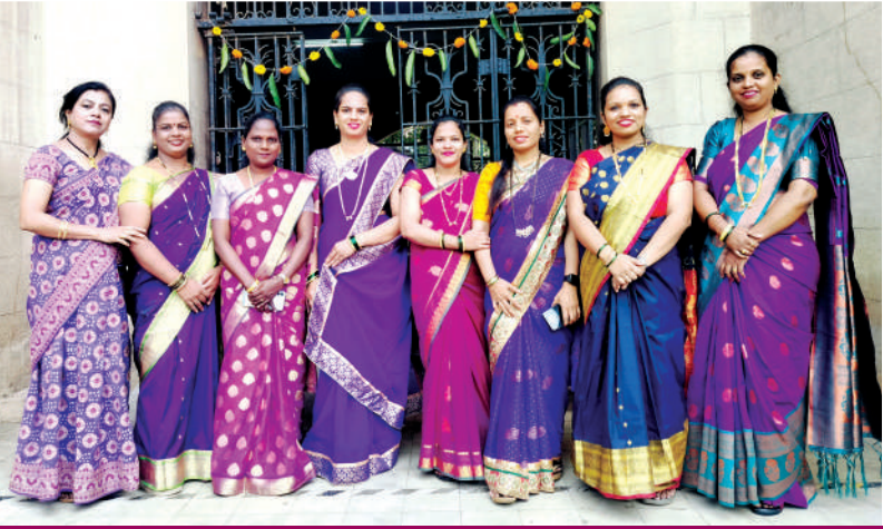
मुंबई विद्यापीठ, फोर्ट परिसर कर्मचारी