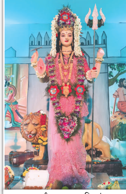
प्रभातची माता, प्रभात मित्र मंडळ, प्रतिष्ठानगर, सायन कोळीवाडा, मुंबई