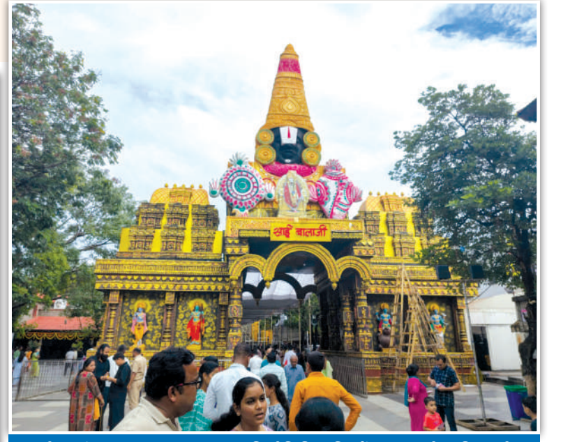
श्री साईबाबांच्या १०६व्या पुण्यतिथीनिमित्त शिर्डीत भक्तांची मांदियाळी

नवरात्री आणि दसऱ्याच्या मुहूर्तावर येणाऱ्या शिर्डीच्या श्री साईबाबांच्या १०६व्या जयंतीनिमित्त शिर्डी मंदिराच्या साई बालाजी प्रवेशद्वारावर नयनरम्य सजावट करण्यात आली आहे. हि अफलातन सजावट पाहण्यासाठी श्री साई भक्तांची मोठी गर्दी होत आहे. साईबाबा भक्त शिर्डीच्या साईबाबा ट्रस्टने बाबांच्या पुण्यतिथीनिमित्त केलेल्या सोयी-सुविधांचे आणि सजावटीचे मुक्त कंठाने कौतुक करीत आहेत.