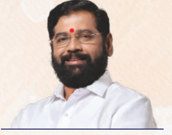
एकनाथ शिंदे मुख्यमंत्री

कौशल्य, रोजगार, उद्योजकता व नाविन्यता विभाग, महाराष्ट्र शासन